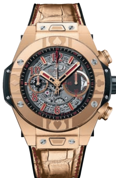
45 __ Марка Hublot все поставила на карту