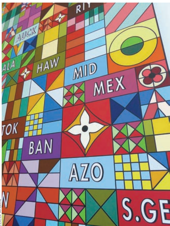
52 __ Louis Vuitton открыл фабрику времени