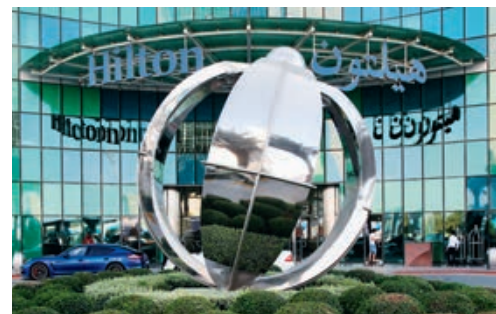
— Отель Hilton Capital Grand