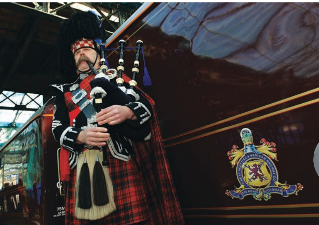
26 Путешествие по Шотландии на поезде Belmond Royal Scotsman