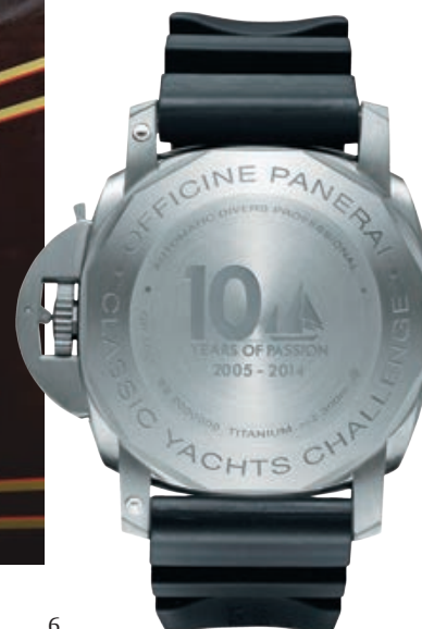
38 Итоги Panerai Classic Yachts Challenge 2014