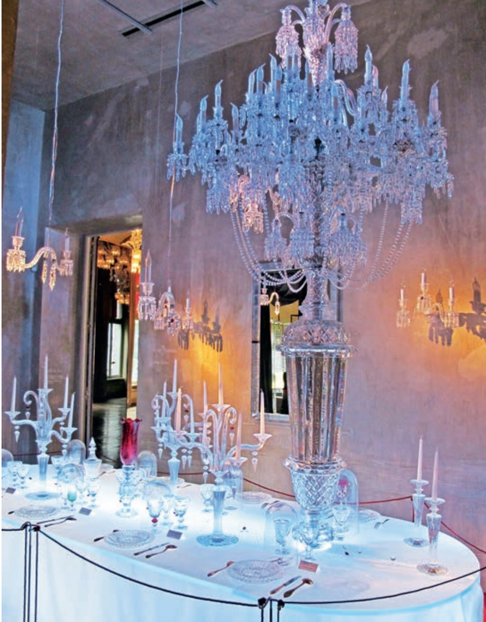
В ПАРИЖСКОМ МУЗЕЕ ВАССАРАТ ХРУСТАЛЬ ОТЛИЧАЕТСЯ ОТЛИЧНЫМ ВКУСОМ. ТЕПЕРЬ И ЗАПАХОМ