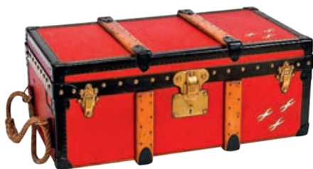
СУНДУК, ПРИНАДЛЕЖАВШИЙ АЛЬБЕРУ КАНУ

Показ Жескьера был самым ожидаемым в новом сезоне. Его открывала модель Фрея Эриксен в коротком платье-трапеции молочно-голубого цвета и черном кожаном тренче. В ее руках красовалась Petite Malle — сумка, которую журналисты немедленно окрестили одной из главных в новом сезоне.