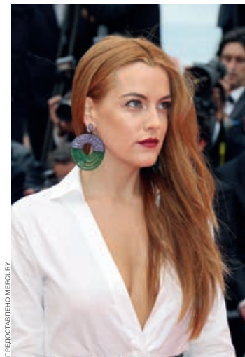
РАЙЛИ КИО В УКРАШЕНИЯХ DE GRISOGONO НА КАННСКОЙ ПРЕМЬЕРЕ, 19 МАЯ 2014 ГОДА