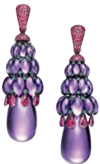
СЕРЬГИ MELODY OF COLOURS, БЕЛОЕ ЗОЛОТО, АМЕТИСТЫ, РУБИНЫ