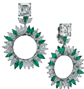
СЕРЬГИ HIGH JEWELLERY, БЕЛОЕ ЗОЛОТО, ИЗУМРУДЫ, БРИЛЛИАНТЫ