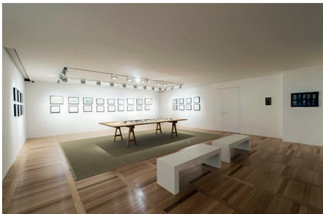
ESPACE LOUIS VUITTON В ВЕНЕЦИИ