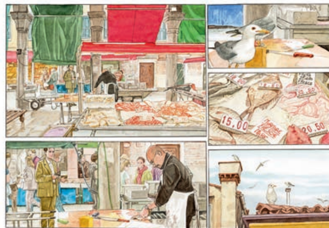
РИСУНОК ХИРО ТАНИГУЧИ

Один из лучших альбомов манга Хиро Танигучи — «Далеко по соседству» (A Distant Neighbourhood, 1998) — посвящен путешествию: его герой возвращается в детство, в деревню, где родился и вырос. Это трогательное возвращение в 2010 году даже удостоилось экранизации немецким режиссером Сэмом Гарбарски. Собираясь в Венецию, Танигучи изучил ее по путеводителям и фотографиям, но был удивлен, насколько город оказался больше, чем он его себе представлял. Это чувство знакомо путешественнику, впервые плывущему по узким улицам и многочисленным мосткам. Таким себя чувствует и герой манга-истории Танигучи. Вот он бродит по лабиринту улиц, позирует на Сан-Марко или уворот Арсенала, смотрит на Гранд-канал. На тех рисунках, где его нет, есть город его глазами, и это зрелище под стать акварелям Каналетто, позволяющим в деталях изучить Венецию XVIII века. Когда-нибудь городские пейзажи Танигучи станут источником знаний о Венеции начала XXI века: туристы, высунувшиеся из окна отеля; регата на Гранд-канале; отдыхающие на пляже в Лидо; белье на веревках, перекинутых через улицу; грандиозный вид на город и лагуну с высоты кампанилы Сан-Марко и, наконец, величественная панорама Венеции, увиденная сверху, в которой мало что изменилось со времен Каналетто, разве что так высоко