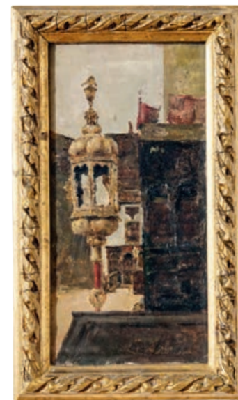
КАРТИНА МАРИАНО ФОРТУНИ