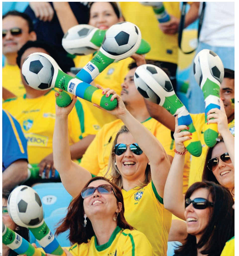
МИТИНГИ БРАЗИЛЬЦЕВ ПРОТИВ ЧЕМПИОНАТА МИРА ЗА ПРЕДЕЛАМИ СТАДИОНОВ ВОВСЕ НЕ ОЗНАЧАЮТ, ЧТО НАРОД ОХЛАДЕЛ К ФУТБОЛУ