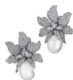
___David Webb, серьги, 1960-е годы, золото, барочный жемчуг, бриллианты, аукцион Phillips, эстимейт $15–20 тыс.