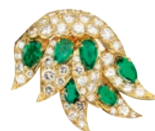
___Van Cleef & Arpels, брошь с бриллиантом Walska Briolette Diamond, 1971 год, золото, бриллианты, изумруды, сапфиры, продана на Sotheby's в ноябре 2013 года за 9 685 000 швейцарских франков