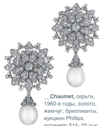
___Chaumet, серьги, 1960-е годы, золото, жемчуг, бриллианты, аукцион Phillips, эстимейт $15–20 тыс.

Украшения с редкими камнями — цветными и бесцветными бриллиантами, рубинами, изумрудами, сапфирами, жадеитами — на аукционах обычно продаются очень дорого. Здесь на первый план выходят характеристики камней, их происхождение и историческое значение. Несмотря на существенные комиссионные, аукционные дома по-прежнему остаются основным местом приобретения редких драгоценностей. Правда, не только во время торгов: неподобающие украшения можно купить по цене ниже эстимейта у владельца (но с комиссией дома), который все равно вряд ли сможет в ближайшие пару лет после появления лота в каталоге выгодно продать его на аукционе.