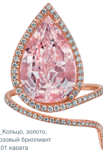
___Кольцо, золото, розовый бриллиант 9,01 карата (чистота VS1, цвет Fancy Pink), бесцветные бриллианты, продано на Phillips в декабре 2013 года за $2 965 000