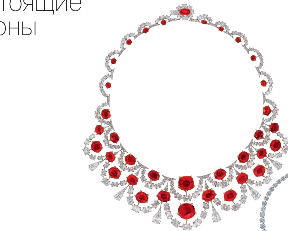
___Колье, бирманские рубины, бриллианты, продано на Christie's в ноябре 2013 года за $6 402 240