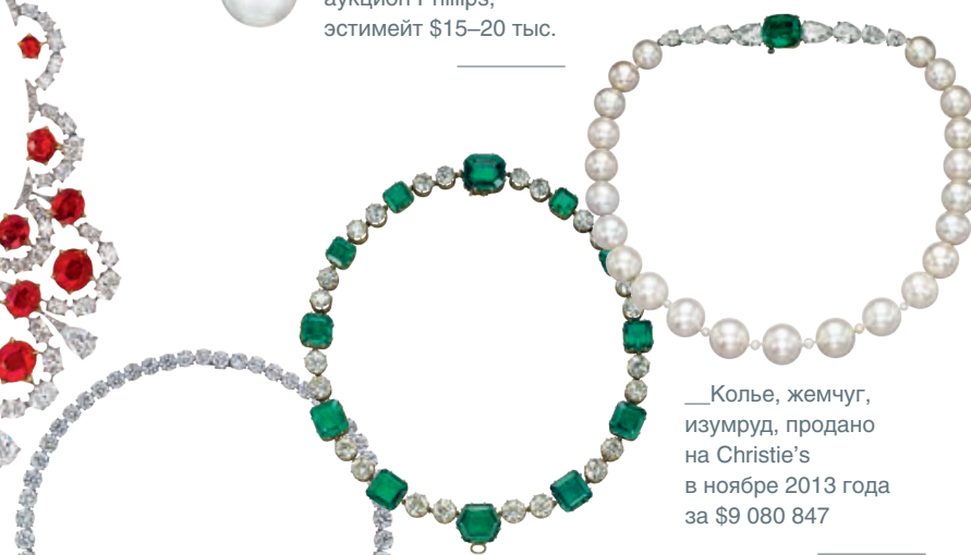
___Колье, жемчуг, изумруд, продано на Christie's в ноябре 2013 года за $9 080 847