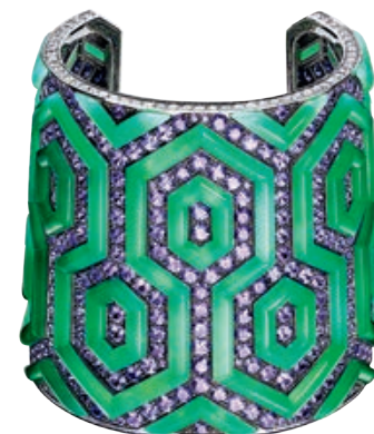
— Браслет Mosaico Teodora , золото, лиловые сапфиры, бриллианты, зеленые хризопразы

видит проблемы в переключении с одного предмета на другой — как и в том, чтобы консультировать бренды, работающие в разной стилистике. «Я просто помогаю свежим взглядом художнику, долгое время трудящемуся над картиной», — формулирует он задачу креативного директора.