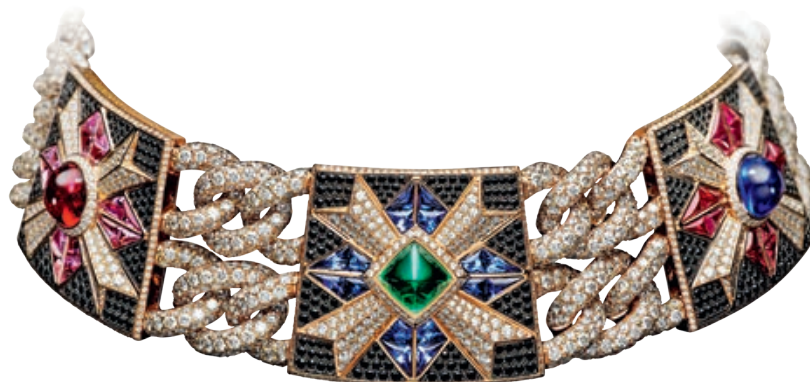
— Чокер Rosa Dei Venti Artemisa , золото, бриллианты, шпинель, сапфиры, изумруд, аметист