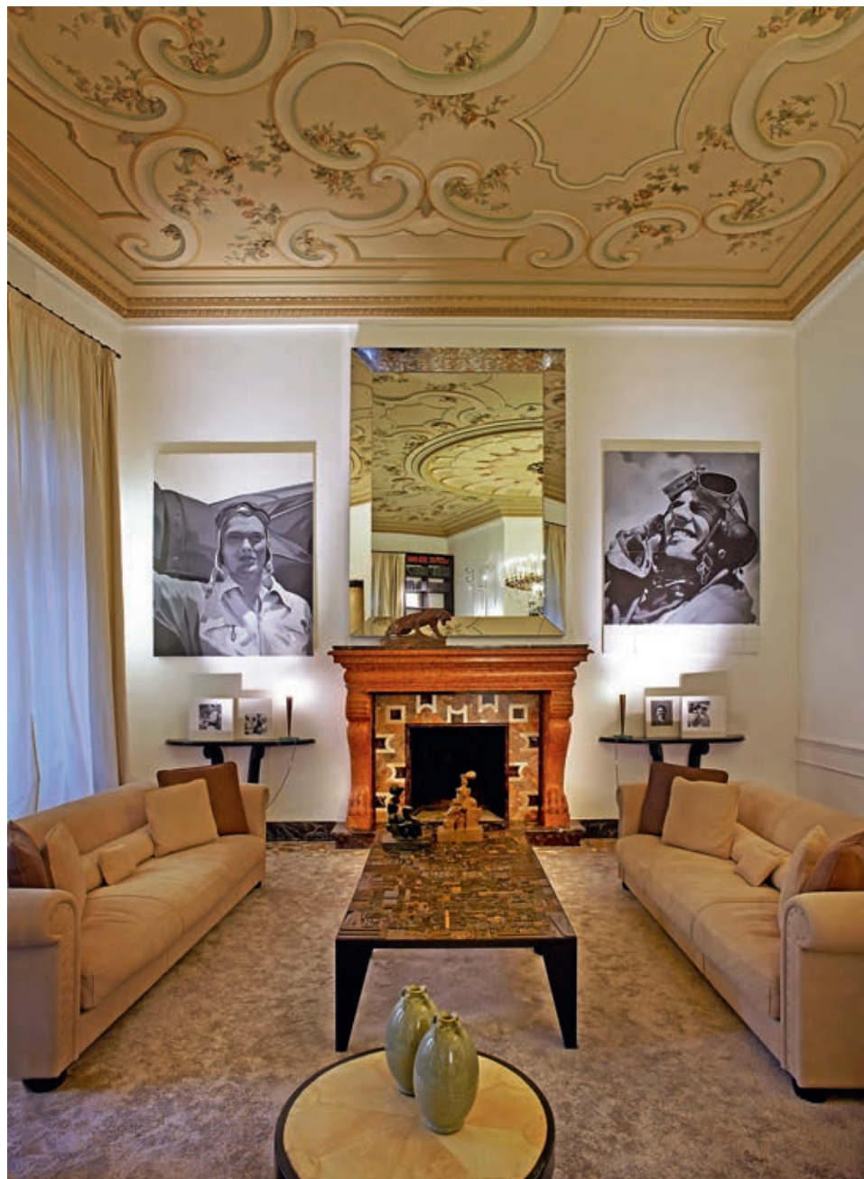
— Интерьеры виллы «Моцарт»