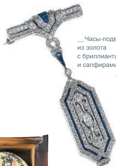
— Часы-подвеска из золота с бриллиантами и сапфирами