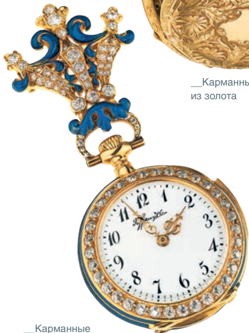
— Карманные часы из золота с бриллиантами и рубинами