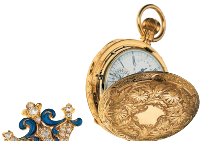
— Карманные часы из золота