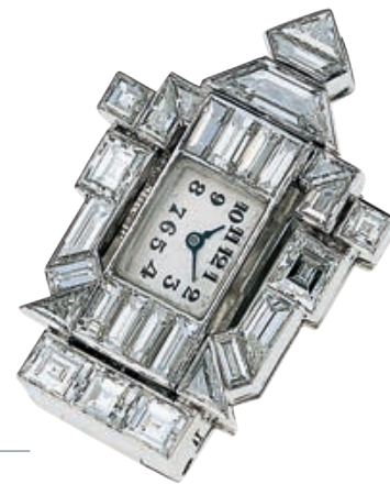
— Часы-подвеска с бриллиантами, 1929 год