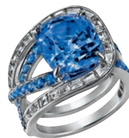
___ Кольцо, золото, бриллианты, сапфиры, первоначально было создано как частный заказ, позднее повторено в регулярной коллекции