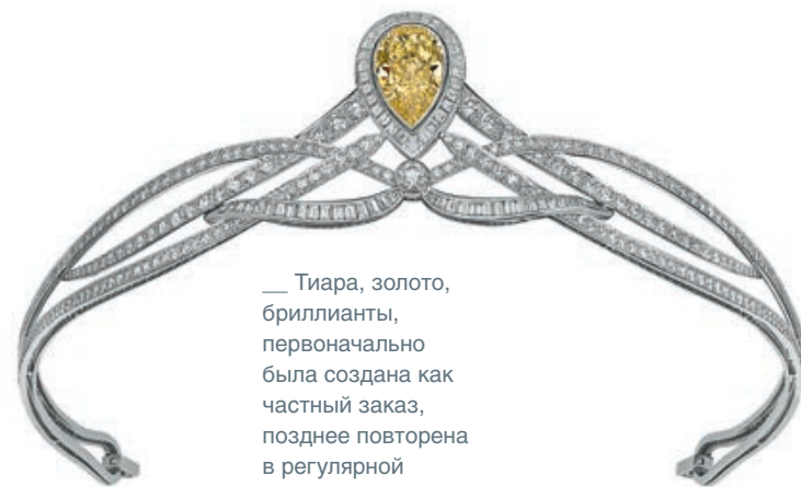
___ Тиара, золото, бриллианты, первоначально была создана как частный заказ, позднее повторена в регулярной коллекции