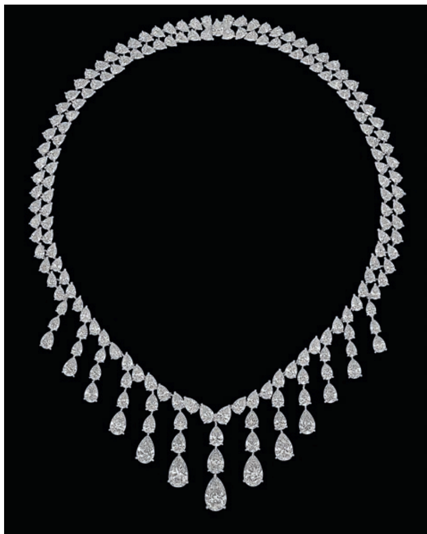
___ Колье с бриллиантами нетипичного для Chaumet дизайна, частный заказ