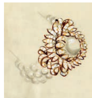
___ Эскиз браслета с цветком (1952 год) и броши-бабочки (1950 год), заказы махарани Бароды

Какие заказы вы бы выделили как главные в истории Van Cleef & Arpels?