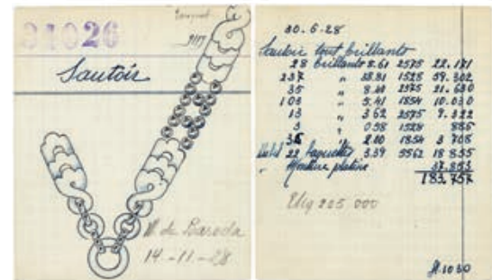
___ Карточки заказов махарани Бароды