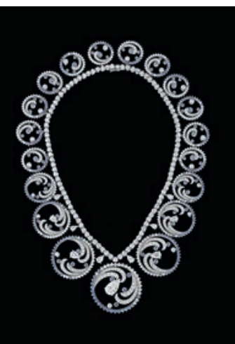
___ Колье Ocean , заказ князя Монако Альбера II