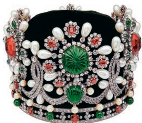
___ Корона, создана для императрицы Ирана Фарах Пахлеви, 1967 год

Да, такие есть: это те заказы, которые стали важными вехами в истории дома. Я бы прежде всего отметил украшенную выдающимися драгоценными камнями корону и ожерелье императрицы Ирана Фарах Пахлеви, созданные в 1967 году. И свежее изделие 2011 года: колье Ocean, которое как подарок к собственной свадьбе нам заказал для княгини Монако Шарлен князь Монако Альбер II.