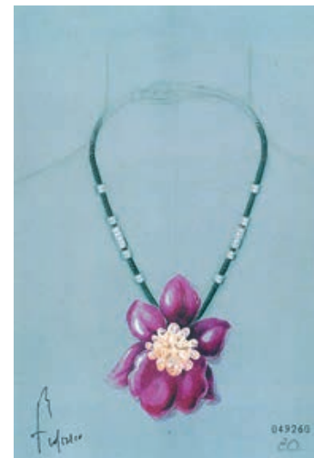
— Украшение-трансформер, вырезанное из цельного рубеллита редкого оттенка (можно носить как подвеску на шнуре, брошь или устанавливать на пьедестал из горного хрусталя как предмет интерьера), заказ российского клиента