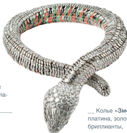
— Колье «Змея», платина, золото, бриллианты, изумруды, эмаль, заказ Марии Феликс, 1968 год