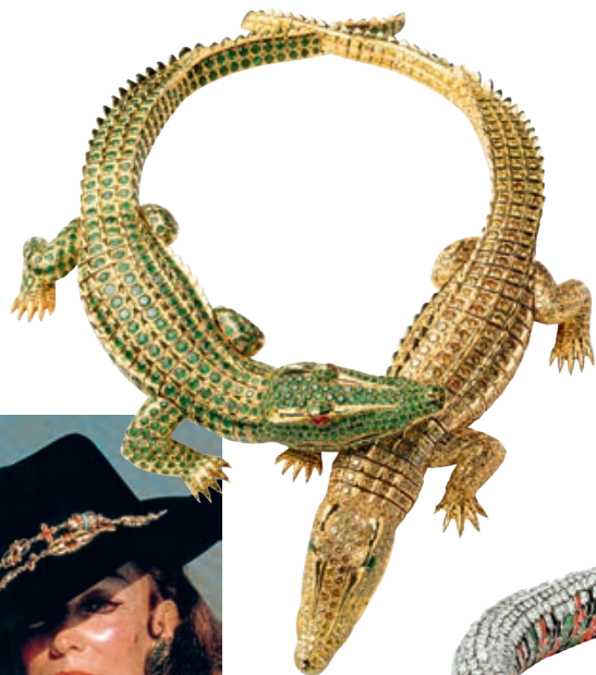
— Колье-трансформер с крокодилами (можно носить как две броши), золото, бриллианты, изумруды, рубины, заказ Марии Феликс, 1975 год