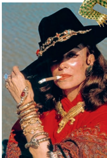
— Мария Феликс в колье с крокодилами, 1975 год