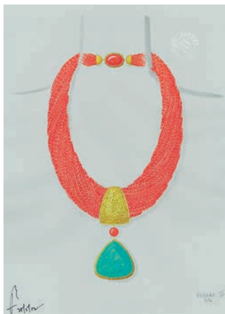
— Cartier, эскиз колье с кораллами характерного для Cartier оранжевого цвета и средневековой бирюзой, заказ российского клиента