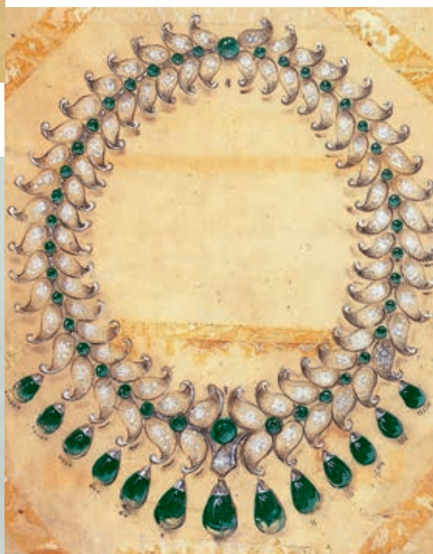
— Van Cleef & Arpels, эскиз колье, заказ махарани Бароды