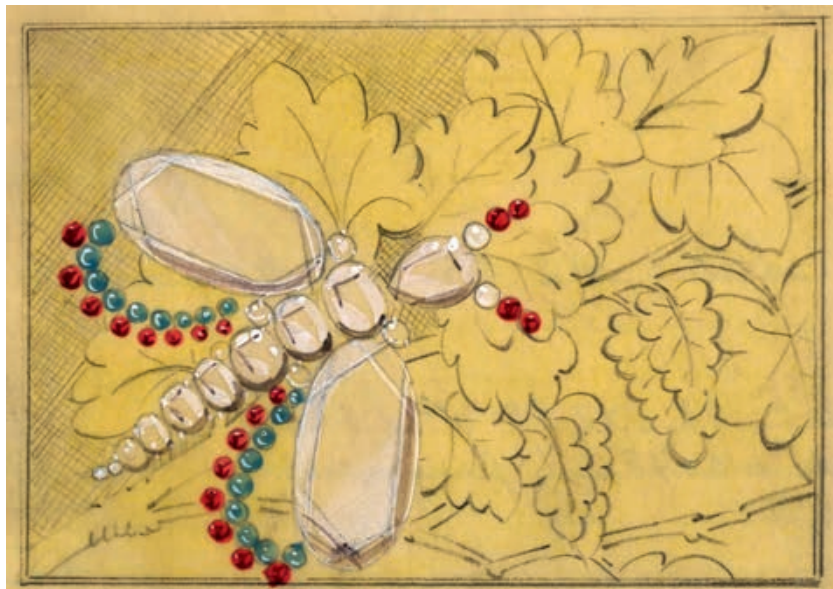
— Van Cleef & Arpels, эскиз портсигара, заказ махарани Бароды