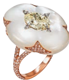
— Кольцо, золото, бриллианты, перламутр