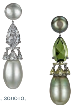
— Серьги, золото, жемчуг, бриллианты