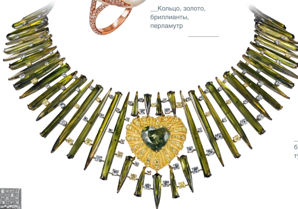
— Колье, золото, бриллианты, турмалины