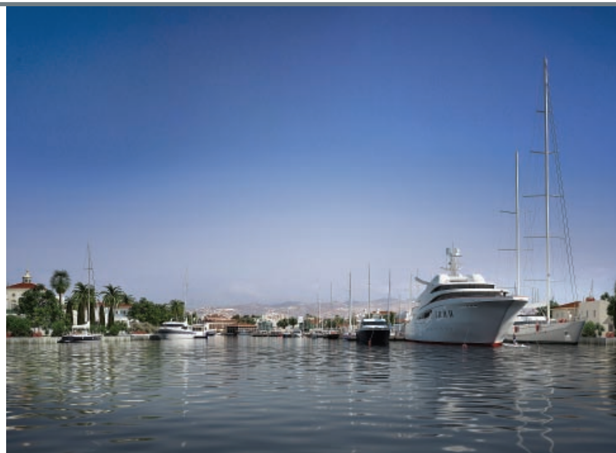
Уходить в офшоры российский бизнес вынуждают не высокие налоги, а проблемы, связанные с защитой собственности

МЭР подготовило свои предложения по борьбе с офшорами. Оно