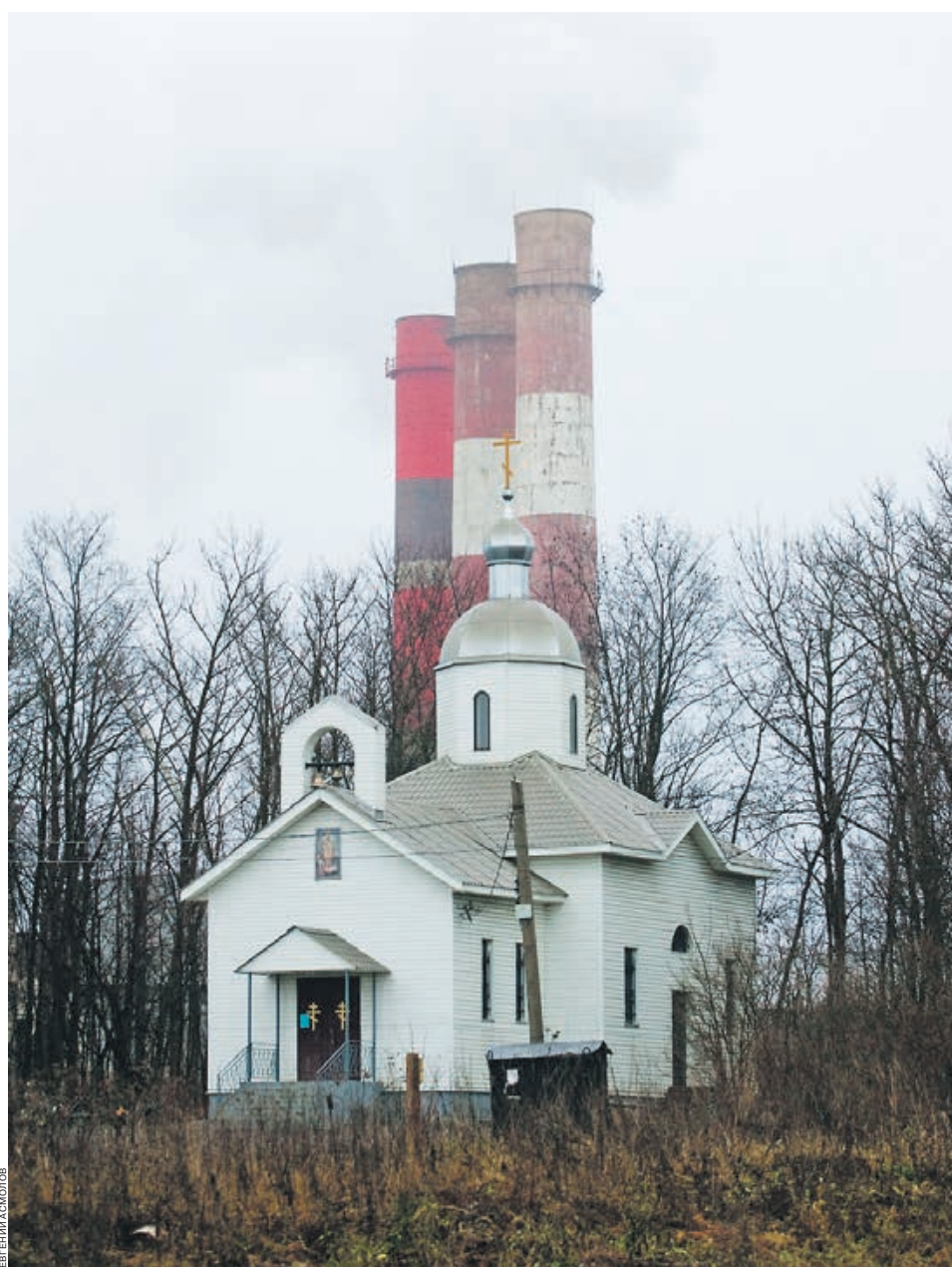
Для спасения жителей моногородов нужны открытие новых производств, профессиональная переподготовка и содействие в открытии бизнеса

Модернизация производства ставит вопрос о закрытии неэффективных производств. Не секрет, что в России сегодня фактически существуют две промышленности: старая советская, пользующаяся зачастую явной и не-