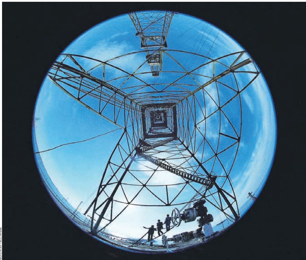
В добывающих отраслях наиболее активно внедряются новые технологии и разработки

Еще интереснее становится, если проанализировать компании по сфере деятельности. Так, выясняется, что 46% компаний, занимающих-