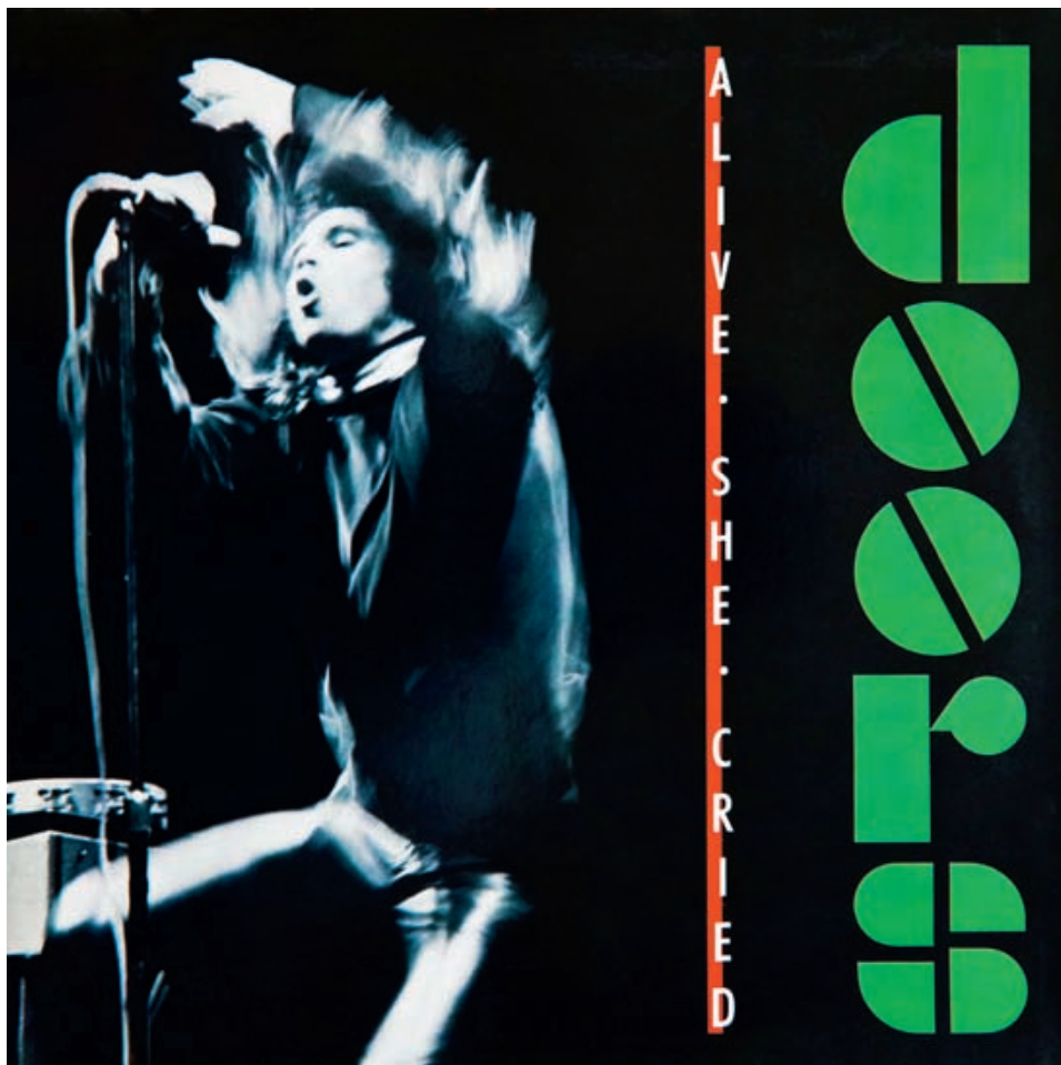
— The Doors, «Alive She Cried», 1983

диск, упакованный в конверт с постерами, не сравнится ни с каким mp3