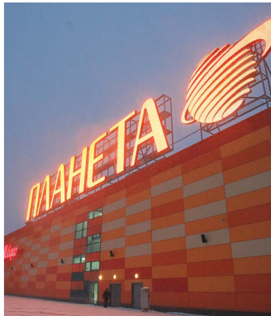
Долгострой ТРК «Планета» подорожал к моменту сдачи почти вдвое до 9 млрд рублей