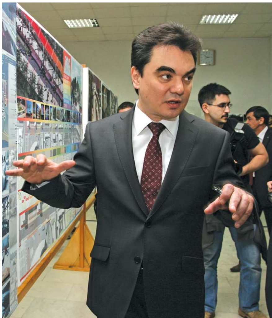
Сити-менеджер Уфы Ирек Ялалов пообещал местному бизнесу зеленый свет в отличие от иногородних ритейлеров