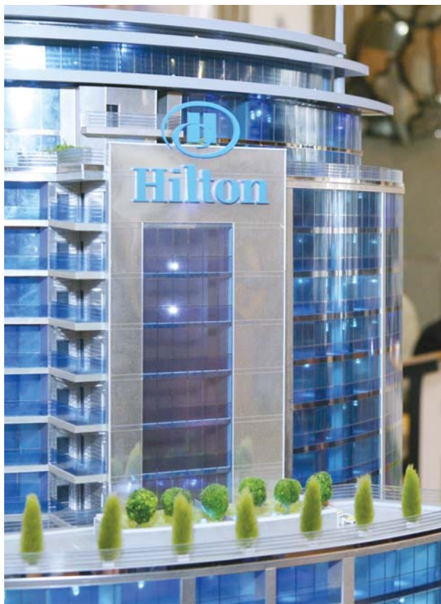
В управление сети Hilton может перейти большинство новых отелей Уфы