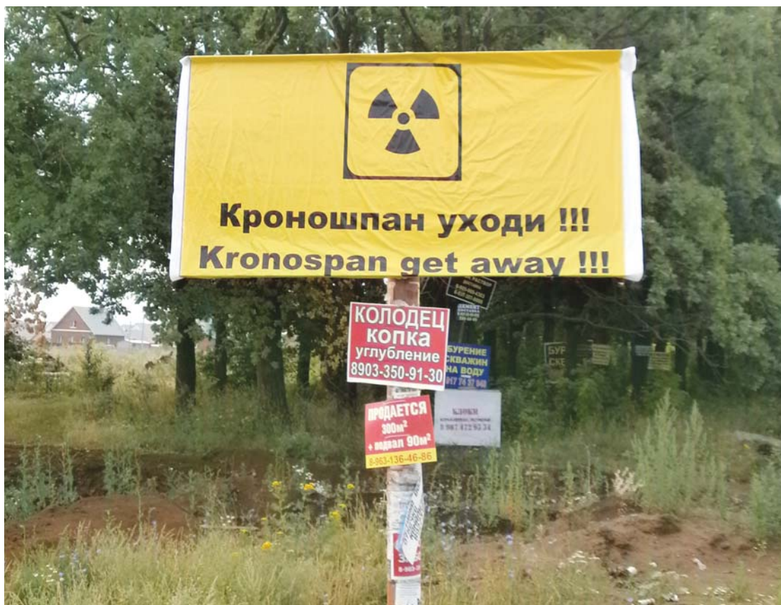
Протест против завода «Кроношпан» вопреки прогнозам не угас и после выборов в Курултай