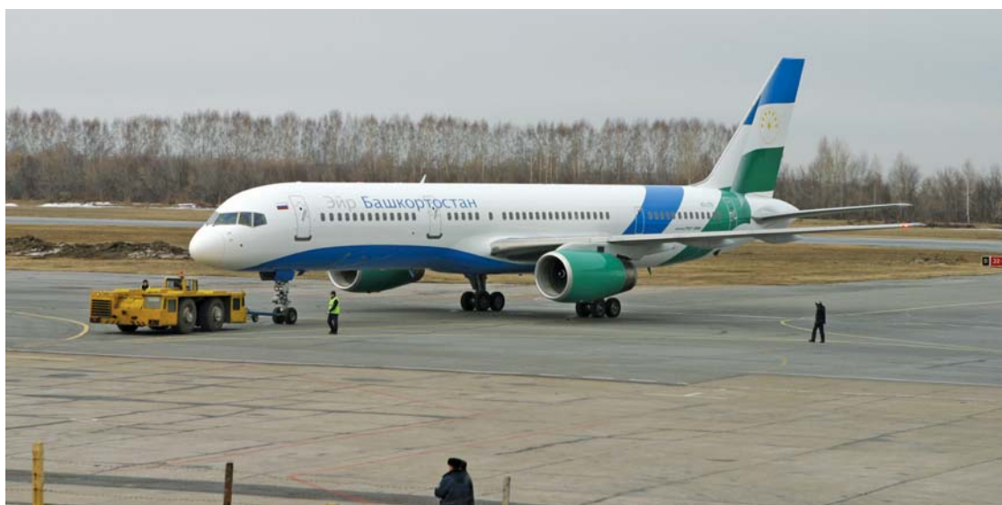
Авиакомпания «Башкортостан» перестала летать под флагом республики