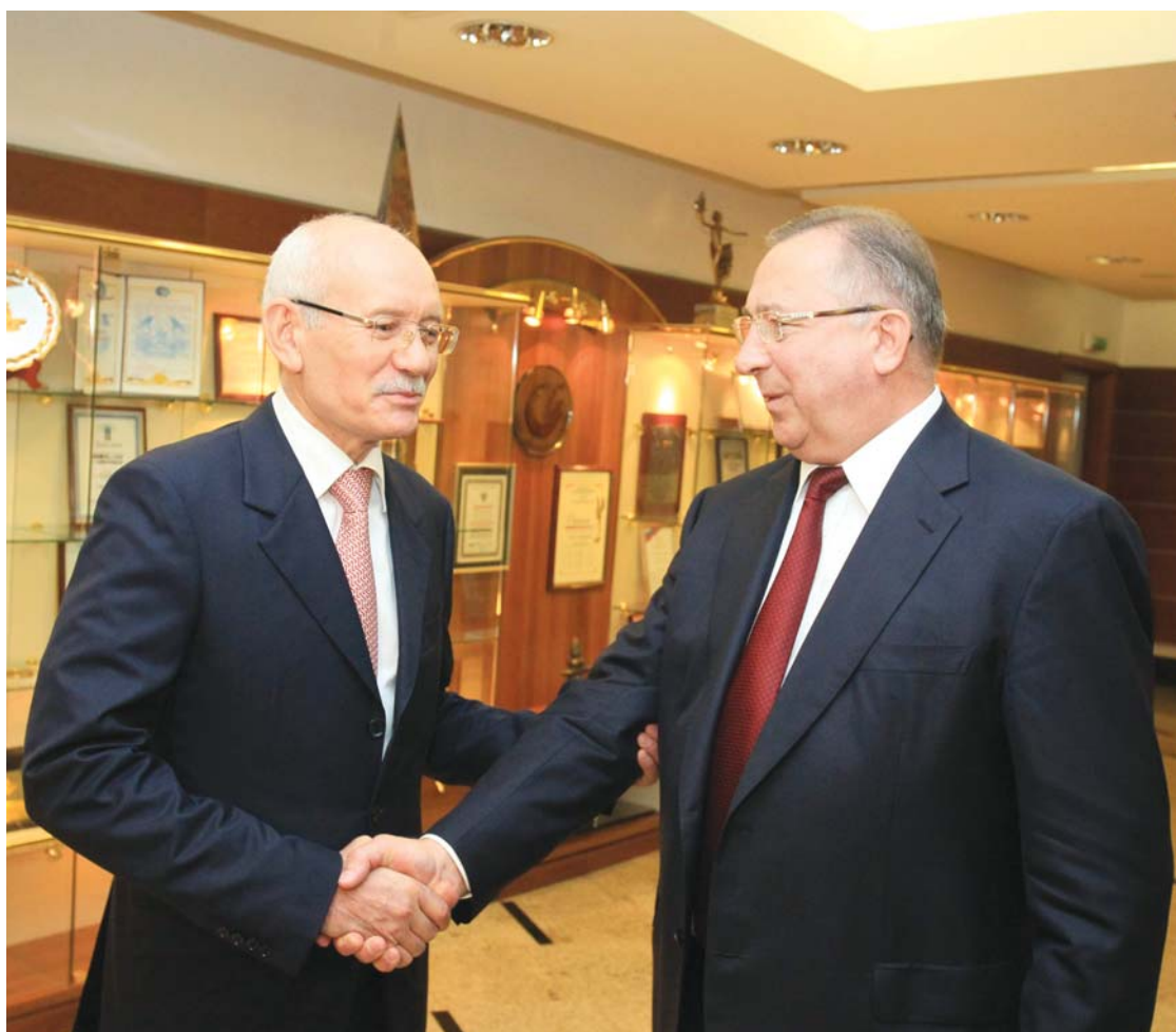
«Транснефть» купила миноритарные пакеты башкирских «дочек» за 12,5 млрд рублей (справа — президент «Транснефти» Николай Токарев)