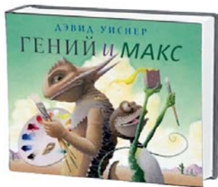
название: Гений и Макс автор: ДЭВИД УИСНЕР издатель: Розовый жираф

Винтажную классику сейчас гораздо переиздавать многие, но «Приключения Петрушки» это именно что не классика — книжка семидесятих годов, где веселый Петрушка в одиночку творит отдельно взятую кукольную революцию, вдохновлена и советскими пропагандистскими сказками, и «Тремя толстяками», и народным балаганом, и «Приключениями Чиполлино» — и удивительно независима от них от всех. Все герои тут — куклы, и им легко можно поотрывать ноги или пришить второе лицо и рот на затылке. Тут совершенно нет всей этой невозможной советской риторики об угнетателях и угнетенных, на каждой странице просто непрестанно творится веселый балаган. А главная победа Петрушки — в том, чтобы суметь показать остальным жителям кукольного царства, насколько смех сильнее страха. Судя по году первого издания книги, все это, кажется, совсем не про царскую Россию.