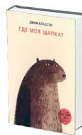
название: Где моя шапка? автор: ЙОН КЛАССЕН издатель: АСТ

Книги про слона Элмера, который был не как все, а в цветную клеточку, и иногда это его сильно расстраивало, зато он всех непрестанно веселил, тоже давно уже имеют статус детской классики — они издаются с 1980-х годов, разошлись миллионами копий и давно уже превратились в игрушки и мультсериал. Книги Дэвида Макки, довольно невинные на вид, считаются одним из первых детских уроков толерантности и мульти- всего на свете: слон то сам перекрасится в серый, чтобы обнаружить, что другие, обыкновенные слоны, любят его именно таким странным, какой он есть, то перекрасит всех остальных и извлечет из этого новый урок: мир хорош именно тем, что наряду с серыми слонами в нем есть и цветные, и наоборот. Так что этот слон не просто великий проказник, что, конечно, очень нравится совсем маленьким детям, для которых он нарисован, но и великий философ, проверяющий свои теории на собственном опыте.