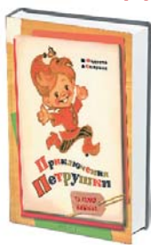
название: Приключения Петрушки автор: М. ФАДЕЕВА, А. СМИРНОВ (С ИЛЛ. Л. ВЛАДИМИРСКОГО) издатель: Росмэн

Винтажную классику сейчас гораздо переиздавать многие, но «Приключения Петрушки» это именно что не классика — книжка семидесятих годов, где веселый Петрушка в одиночку творит отдельно взятую кукольную революцию, вдохновлена и советскими пропагандистскими сказками, и «Тремя толстяками», и народным балаганом, и «Приключениями Чиполлино» — и удивительно независима от них от всех. Все герои тут — куклы, и им легко можно поотрывать ноги или пришить второе лицо и рот на затылке. Тут совершенно нет всей этой невозможной советской риторики об угнетателях и угнетенных, на каждой странице просто непрестанно творится веселый балаган. А главная победа Петрушки — в том, чтобы суметь показать остальным жителям кукольного царства, насколько смех сильнее страха. Судя по году первого издания книги, все это, кажется, совсем не про царскую Россию.