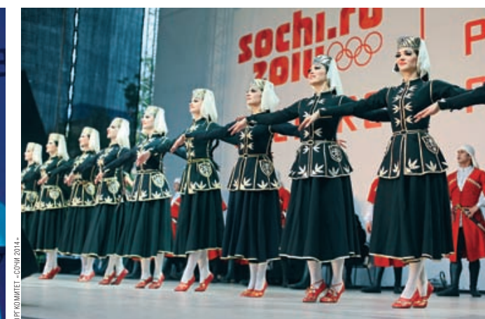
В АВГУСТЕ 2012 ГОДА ФЕСТИВАЛЬ НАЦИОНАЛЬНЫХ КУЛЬТУР «МАРАФОН РЕГИОНОВ РОССИИ» С УЧАСТИЕМ ПОЛУТОРА ТЫСЯЧ АРТИСТОВ ПРОШЕЛ СРАЗУ НА ДВУХ ПЛОЩАДКАХ — В СОЧИ И В КЕНСИНГТОНСКОМ ПАРКЕ В ЛОНДОНЕ

селенного пункта нашей страны. По мотивам лучших новелл профессиональные режиссеры и драматурги создали уникальную театральную постановку, все роли в которой сыграли ведущие российские артисты театра и кино. И уже в декабре 2011-го состоялась московская премьера спектакля, которая прошла при полном аншлаге в столичном театральном центре «На Страстном».