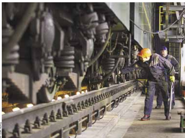
Производители вынуждены самостоятельно высчитывать не только параметры вагонов, но и выгоду будущего владельца

«На IV Международном железнодорожном салоне техники и технологий Ехро 1520 мы презентовали первый образец хоппера, полностью выполненного из композитных материалов. Нам удалось повысить вместительность вагона на 30%, при этом используется тележка 18-