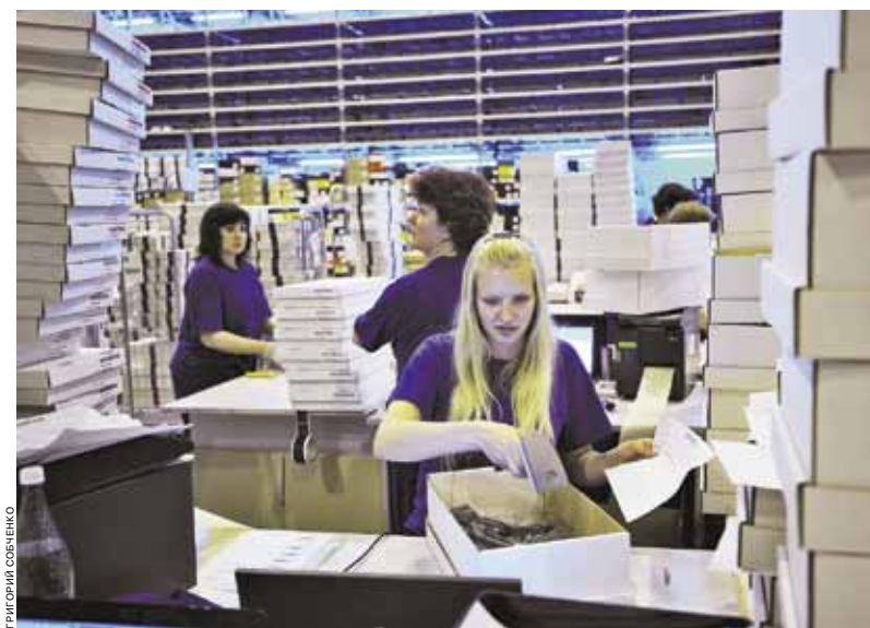
Специфика сервисного бизнеса диктует высокие требования к автоматизации операционной деятельности

По данным системных интеграторов, профессиональные систе-