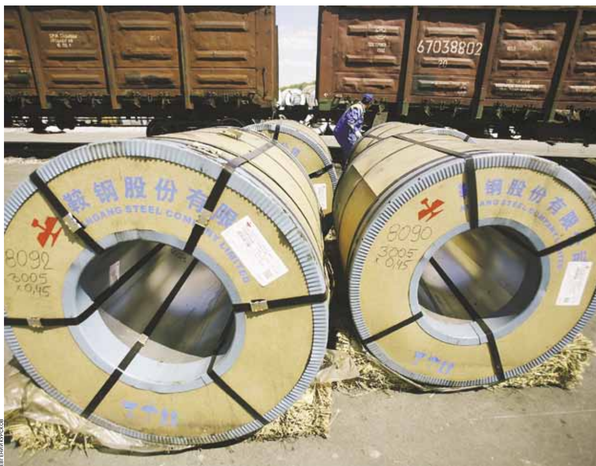
В отсутствие фактической альтернативы железнодорожной доставке грузов для отправителей одним из актуальных вопросов по-прежнему остается доступ к подвижному составу

троль логистики своих грузов и максимальную транспортную безопасность бизнеса. Но при этом отвлекает значительные финансовые ресурсы, которые могли бы быть потрачены на развитие основной деятельности. Кроме того, компании-собственнику приходится брать на себя вопросы технического обслуживания вагонов. «При аутсорсинге транспортной услуги значительно разового отвлечения ресурсов не происходит, но стоимость перевозки в пересчете на тонну груза подчас бывает выше, чем в случае покупки вагона, так как приходится платить агентскую комиссию компании-перевозчику. Степень контроля над подвижным составом значительно ниже, чем при покупке, но снимается вопрос технического обслуживания вагонов. Долгосрочная аренда сочетает в себе преимущества обоих вариантов: компания обеспечивает себе доступ к вагонам на длительный срок по прозрачной фиксированной ставке, сохраняя при этом контроль над вагонами, пользуясь ими как собственными. Техническое обслуживание при этом может взять на себя арендодатель. Преимущество долгосрочной аренды подтверждаются практикой: за последние три года этот сегмент рынка вырос в 2,5 раза. Около 16% всего российского парка вагонов по итогам 2012 года сдавалось в долгосрочную аренду. При этом потенциал роста далеко не исчерпан: для сравнения, в Северной Америке этот показатель превышает 55%», — рассказывает Андрей Цыганов.