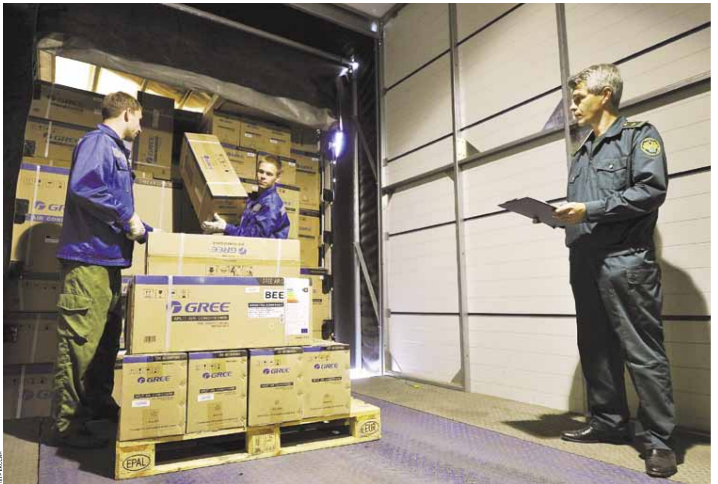
Наибольший интерес для участников ВЭД представляют склады временного хранения, расположенные на территории таможенных органов

Рост внешнеторгового оборота с каждым годом усиливает транспортную нагрузку на крупные российские города. Проблема решается развитием транспортно-логистической инфраструктуры, преимущественно в приграничных субъектах РФ. «В этой связи в настоящее время заинтересованными участниками внешнеэкономической деятельности проводится работа по созданию таможенно-логистических терминалов непосредственно в местах, приближенных к государственной границе РФ. Они должны включать в себя в том числе достаточные площади для осуществления временного хранения товаров и стоянки большегрузно-