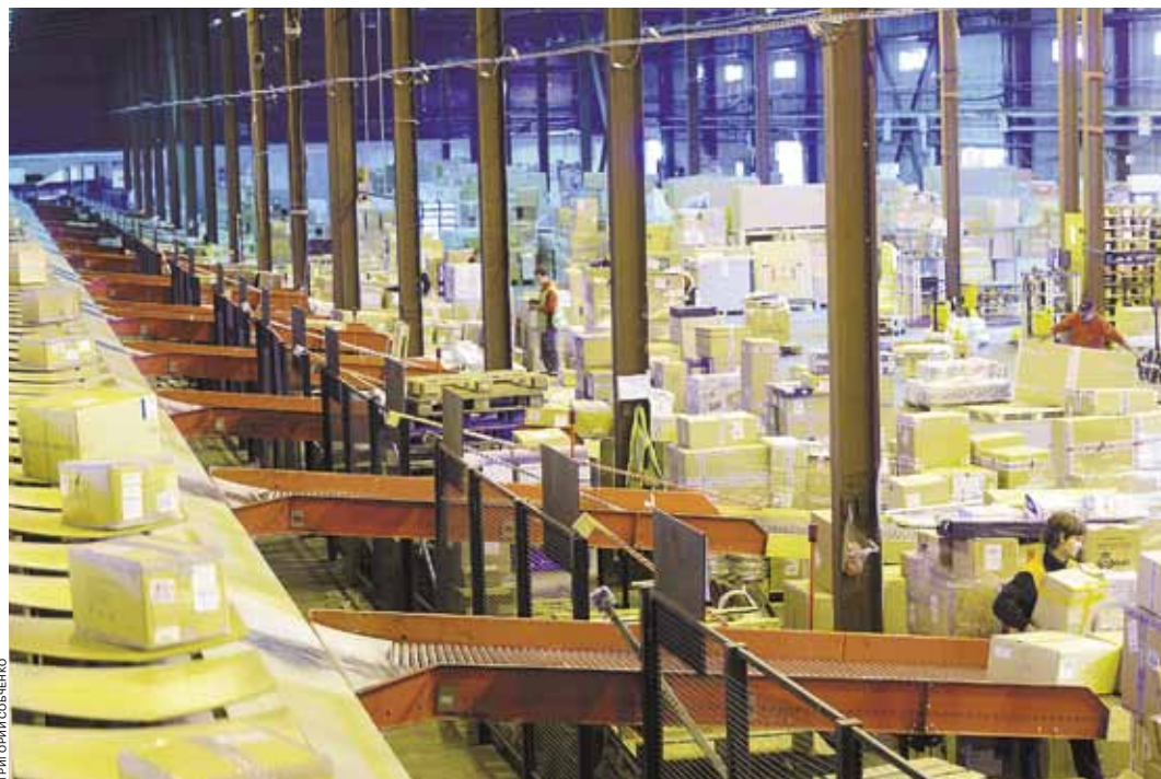
С учетом двукратного роста посылок e-коммерции удовлетворение потребностей именно этой группы клиентов для экспресс-перевозчиков сегодня в приоритете