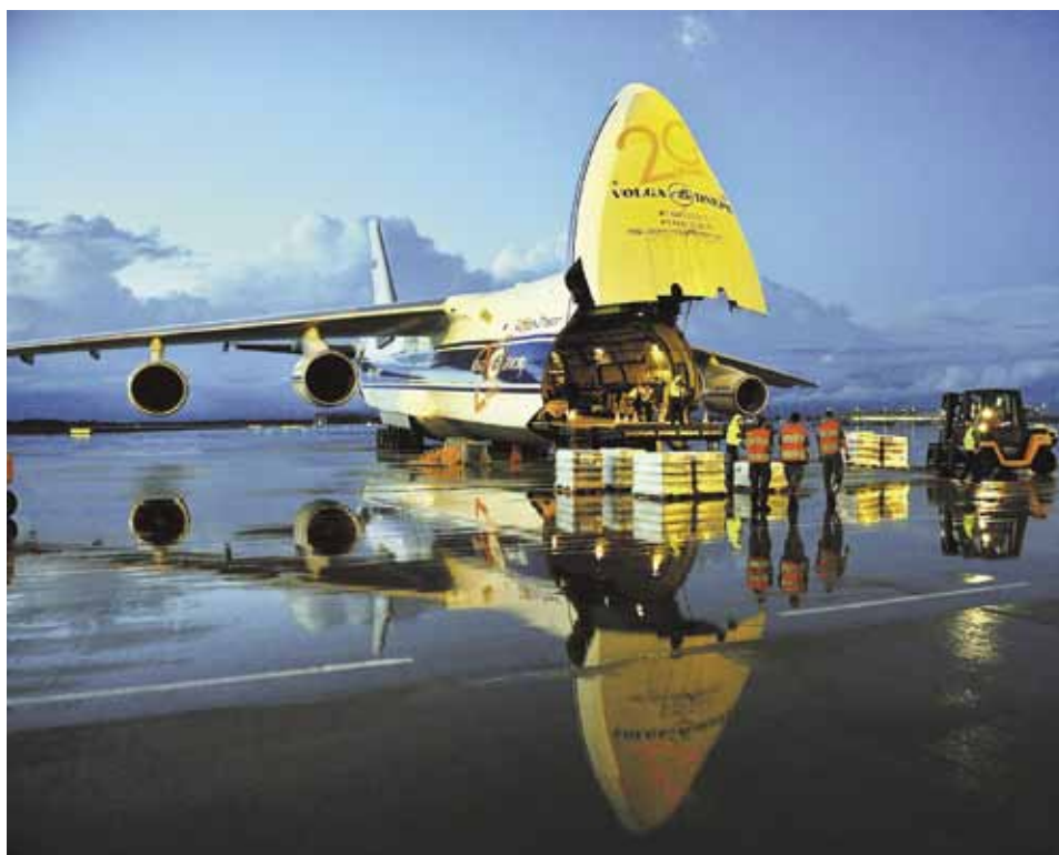
И государственные, и частные авиакомпании нуждаются в поддержке

В августе 2013 года правительство утвердило изменения в правила предоставления субсидий. Первая поправка касается расширения действия программы на турбореактивные самолеты вместимостью от 75 до 103 пассажиров, то есть на Ан-148 и SSJ 100. С вступлением России во Всемирную торговую организацию страна добровольно отказалась от ряда мер поддержки отечественной промышленности, в том числе и авиационной. До последнего времени не действовал ни один инструмент, дающий отечественным самолетам преимущество перед воздушными судами зарубежного производства: в рамках постановления №1212 можно было работать только с воздушными судами кресельной емкостью до 72 мест, то есть, увы, с самолетами иностранного производства. Теперь авиакомпании имеют возможность получить субсидию на приобретение отечественных воздушных судов, также имеющих хорошие перспективы для эксплуатации на межрегиональных маршрутах. На эти цели правительство планирует потратить до 30% от средств, выделяемых на программу. Данное