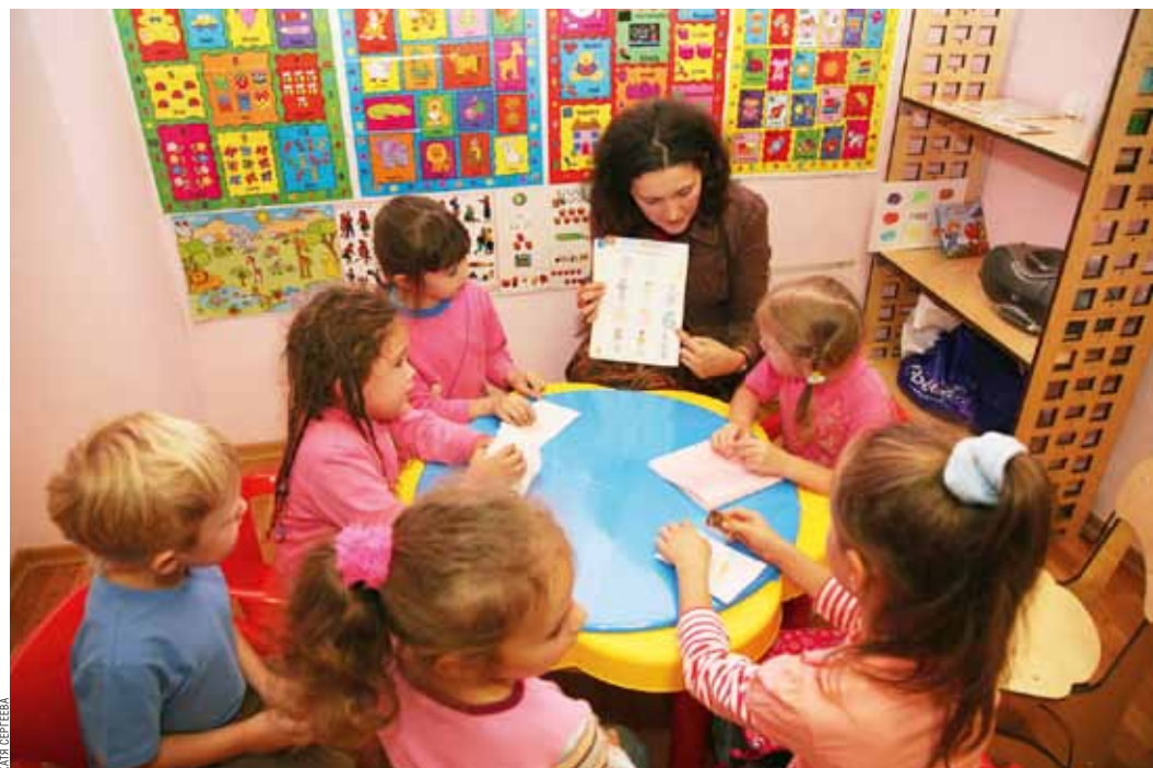
В РЕЗУЛЬТАТЕ РЕАЛИЗАЦИИ ПРОЕКТА «МАМИН ВЫБОР» КОЛИЧЕСТВО ЧАСТНОГО БИЗНЕСА В СФЕРЕ ДОШКОЛЬНОГО ОБРАЗОВАНИЯ ЗНАЧИТЕЛЬНО УВЕЛИЧИЛОСЬ