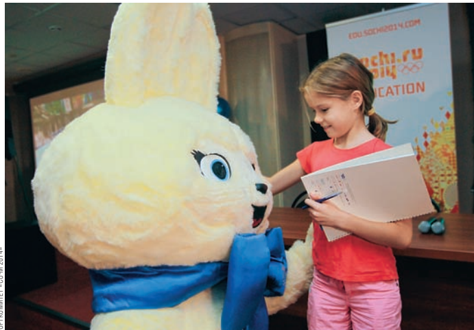
НА ОЛИМПИЙСКОМ УРОКЕ ШКОЛЬНИКОВ ПОЗНАКОМИЛИ С ТАЛИСМАНАМИ СОЧИНСКИХ ИГР