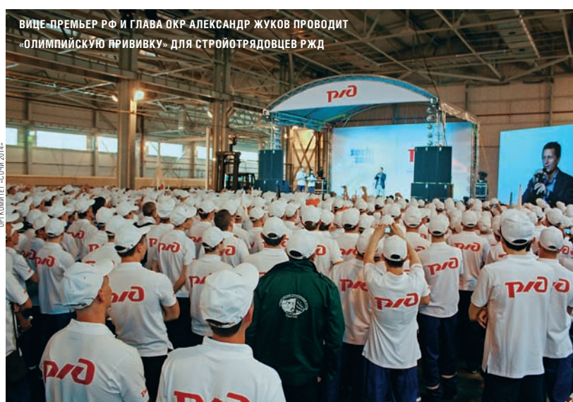
ВИЦЕ-ПРЕМЬЕР РФ И ГЛАВА ОКР АЛЕКСАНДР ЖУКОВ ПРОВОДИТ «ОЛИМПИЙСКУЮ ПРИВИВКУ» ДЛЯ СТРОИТЕЛЬСКИХ ОТРЯДОВ РЖД