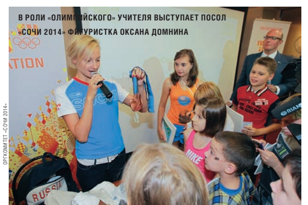
В РОЛИ «ОЛИМПИЙСКОГО» УЧИТЕЛЯ ВЫСТУПАЕТ ПОСОЛ «СОЧИ 2014» ФИГУРИСТКА ОКСАНА ДОМНИНА