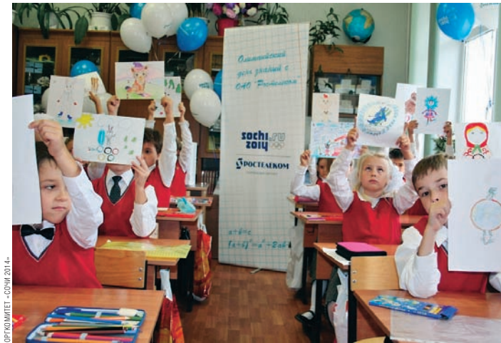
В «ОЛИМПИЙСКОМ ДНЕ ЗНАНИЙ «РОСТЕЛЕКОМА» ПРИНЯЛИ УЧАСТИЕ ТЫСЯЧИ ШКОЛЬНИКОВ ИЗ 60 ГОРДОВ

ТРИ УРОВНЯ Система олимпийского образования «Сочи 2014» предусматривает три уровня создания и реализации образовательных продуктов и программ: популярный, академический и профессиональный.