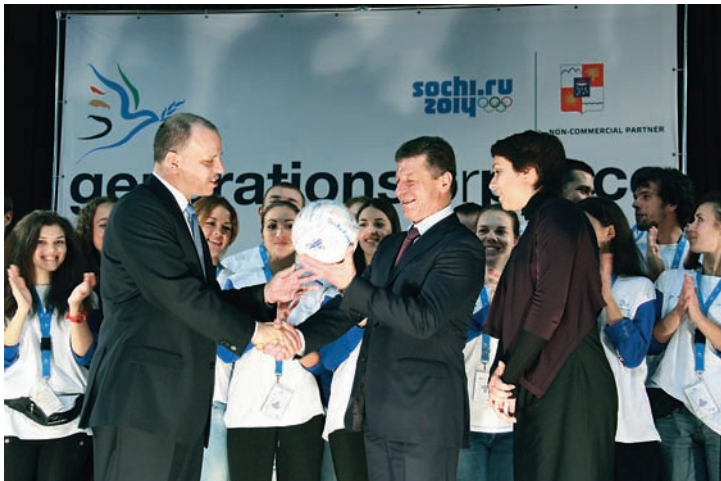
ОСНОВАТЕЛЬ ДВИЖЕНИЯ «ПОКОЛЕНИЯ ЗА МИР» ПРИНЦ ИОРДАНИИ ФЕЙСАЛ АЛЬ-ХУСЕЙН И ВИЦЕ-ПРЕМЬЕР РФ ДМИТРИЙ КОЗАК С ДЕЛЕГАТАМИ ЛАГЕРЯ В СОЧИ