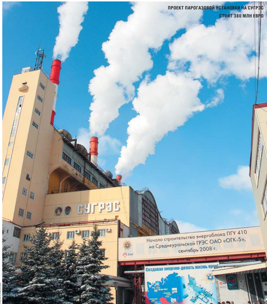
ПРОЕКТ ПАРОВОЗОВОЙ УСТАНОВКИ НА СУГРЭС СТОИТ 380 МЛН ЕВРО