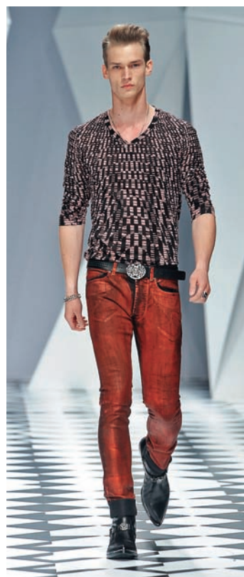
VERSACE ВЕСНА-ЛЕТО 2011