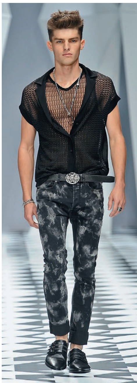
VERSACE ВЕСНА-ЛЕТО 2011