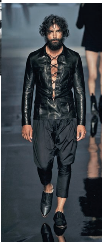
GAULTIER ВЕСНА-ЛЕТО 2011