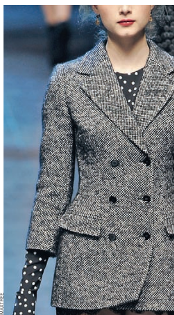
Dolce & Gabbana