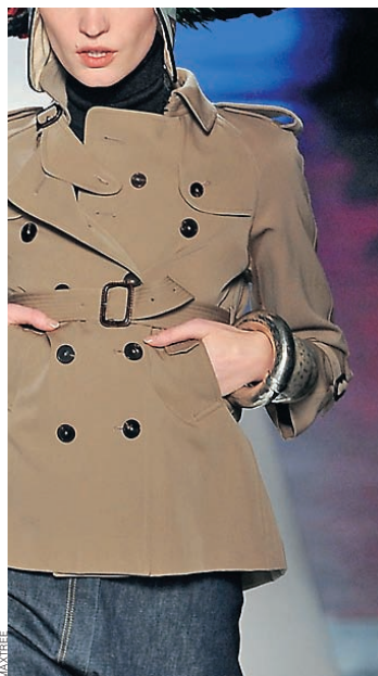
Jean Paul Gaultier