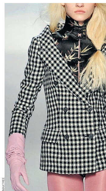
Jean Paul Gaultier