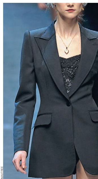
Dolce & Gabbana