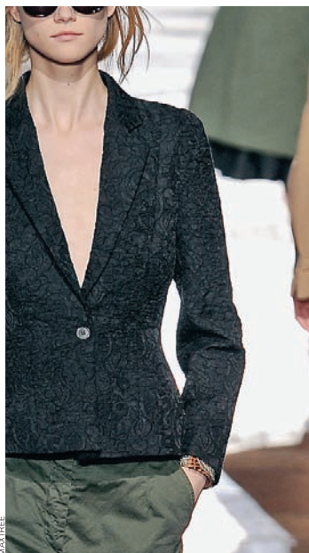
Dries van Noten