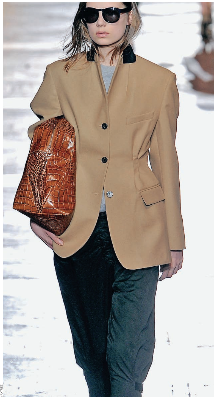
Dries van Noten