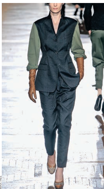
Dries van Noten