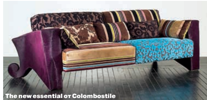
The new essential of Colombostile

Даже если вы не сторонник классического досуга «с пледом, книжкой, у камина», согласитесь, что зимой мы проводим больше всего времени на диване. Или в кресле. И каковы они, эти диваны и кресла, вопрос совсем не праздный. Чем комфортнее мягкая мебель, тем приятнее проведенное в ней время. Новинки ведущих производителей помогут создать обстановку, располагающую к правильному зимнему досугу.