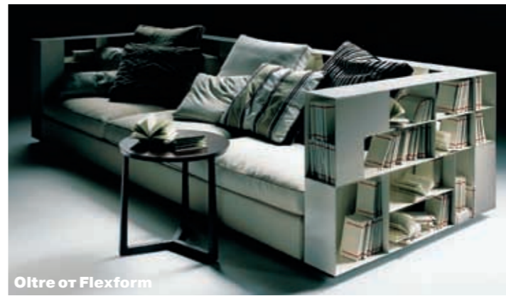
Oltre of Flexform

диван, в котором швы вывернуты наружу. Сейчас же это довольно распространенный прием. Например, воспользовалась им Паола Навоне в модели House (она может быть и креслом, и диваном) для Baxter.