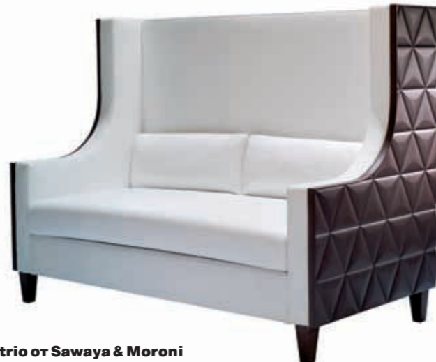
Atrio of Sawaya &amp; Moroni

Важная тенденция этого года заключается в том, что классическая мягкая мебель скрылась в тени более современных и неформальных моделей. Разумеется, при желании можно найти и настоящее кожаное клубное кресло, и стеганый диван в розочках и с бахромой, но они не очень актуальны. Доказательство тому — то, что даже такие апогогеты серьезной мягкой мебели как Baxter, Rolf Benz, Walter Knoll, Poltrona Frau и другие выпустили совершенно нетипичные для них модели. Диваны и кресла респектабельно уютные, стали проще и ближе к людям.