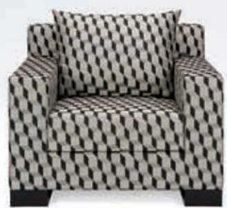
London of Armani Casa

Под комфортностью подразумевается вовсе не степень удобства дивана. Если мы говорим о лучших производителях мягкой мебели (преимущественно немецких и итальянских), то все их модели, безусловно, удобны и сконструированы с учетом особенностей человеческого тела и его потребностей. Другой вопрос, что комфортность их относительно. Например, сейчас довольно популярны облегченные жесткие диваны на ножках и вращающиеся кресла на металлической основе. И те, и другие крайне симпатичны, и провести в них некоторое время можно не без удовольствия, но если речь идет о ленивом отдыхе долгими зимними вечерами-воскресеньями, то они не очень подходят. В них не развалишься, не заберешишь с ногами, не задремлешь, убаюканный фильмом или рассказами жены. Даже чисто психологически худосочные поджарые диваны и кресла на высоких ножках производят деловитое впечатление, не располагающее к праздности. Правильная зимняя мебель — солидная, вместительная, относительно мягкая и непременно уютная. К счастью, таковой предостаточно. Причем удивитель-