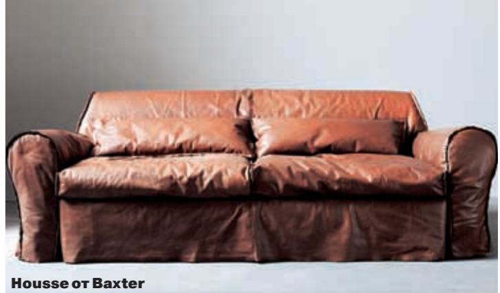
House of Baxter

ными деталями: декоративными пуговицами, простежкой, подушками и кожаными ручками. Кресло Leatherworks от Eda придумано братьями Кампана и является, пожалуй, апофеозом тенденции. Оно не только не серьезное, но даже какое-то вопиюще антибуржуазное. Сшитое из множества различных кусочков кожи, кресло напоминает неопрятную рептилию в процессе смены шкуры. При этом сделано оно было со всем тщанием, стоит совсем недешево и всем требованиям комфорта удовлетворяет. Как и другая мебель в этом духе. Демократизм коснулся лишь ее внешнего вида.