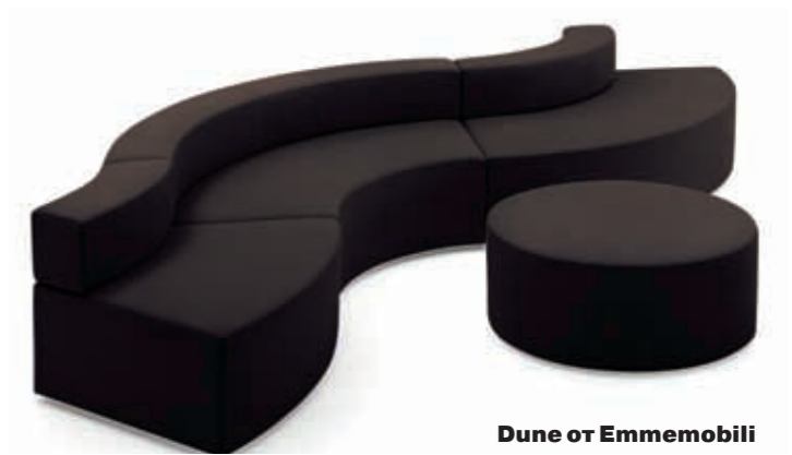
Dune of Emmebobil

кожи. С моделью Volant от Morgo (опять же, и кресло, и диван) коллекцию Baxter объединяют вывернутые швы и то, что дизайнер тоже была женщиной — Патрисия Уркиола. Выглядит же этот диван за счет материи еще неформальнее. И поверьте на слово (а лучше попробуйте сами), удобнее диван надо очень поискать. Модели Polder и The Worker, придуманные Хеллой Йонгерис для Vitra (вполне логично, что эту тенденцию продвигают женщины-дизайнеры), более собранные, но не менее уютные. Строгая форма компенсируется забав-