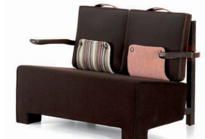
The Worker of Vitra

А в кресле Sellerina XL швы дополнительно отделаны шерстью. Дизайнер уже давно склоняла фабрику в сторону большей демократичности, и в итоге марка окончательно сдалась. Коллекция Punto Oго кажется сделанной вручную в маленькой мебельной мастерской. Грубо сшитые чехлы, шнурки, заметные стежки, швы наружу, клепки — в ней используются несвойственные солидной мебели приемы, и благодаря им коллекция выглядит уютно. При этом Навоне не изменила традициям марки — все сделано из высококачественной