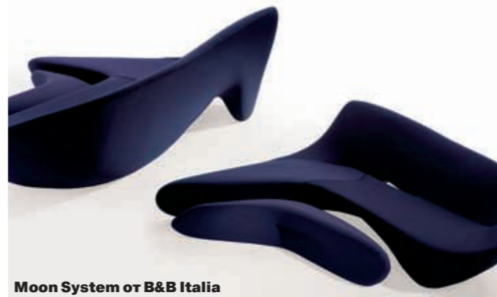
Moon System of B&amp;B Italia