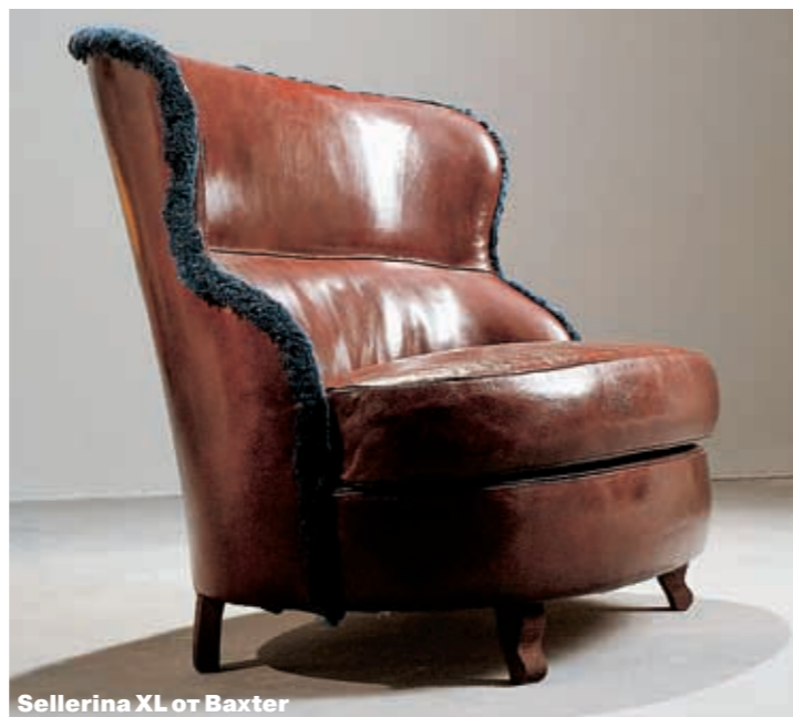
Sellerina XL of Baxter

Дизайнеры придают им вид домашний и уютный, соответствующий духу частной квартиры, а не приемной или английского клуба, как это было недавно. Например, пару лет назад было сложно представить