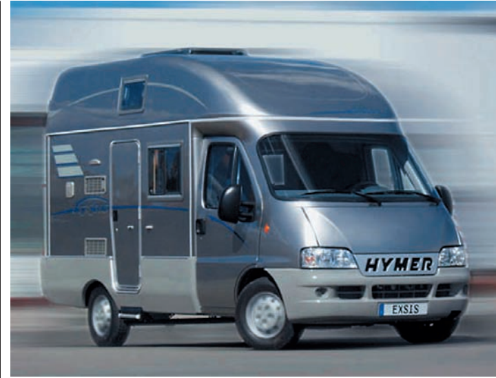
«Хюмермобилю» сперва хотели завоевывать кошечки российских олигархов. Но, потерпев неудачу, переориентировались на средний класс

Словом, автотуризм — это такой отдых, которому наши туристы еще должны учиться и учиться.