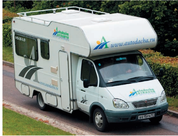
Автодом «Купава» изнутри почти не отличаются от западноевропейских аналогов. Только строятся на базе «Газели».

Пожалуй, самые простые автодома — это туристические прицепы или трейлеры. Они, кстати, могут быть разборными. Такой трейлер — своего рода палатка на колесах, стены которой сделаны из брезента или стекловолокна и которая монтируется на месте парковки. Одни трейлеры буксируются как обычные прицепы на жесткой сцепке, другим необходимо «посадочное седло», как у грузовика. Некоторые трейлеры устанавливаются как надстройки на автомобили типа пикап. Более сложные и более комфортные конструкции совмещают в себе сам автодом и жилое помещение, включающее в себя гостиную, кухню, спальни, одна из кото-