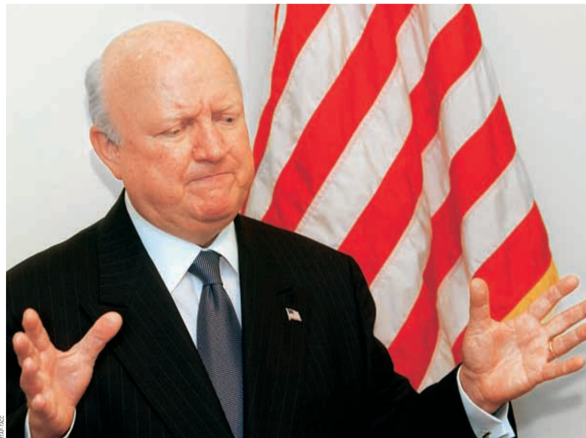
МИНИСТР ЭНЕРГЕТИКИ США СЭМЮЭЛ БОДМАН СЧИТАЕТ, ЧТО ПРОИЗВОДИТЕЛИ НЕФТИ ПОТЕРЯЛИ КОНТРОЛЬ НАД РЫНКОМ, И ЦЕНЫ ОПРЕДЕЛЯЮТСЯ СПЕКУЛЯНТАМИ

Политика стран ОПЕК, направленная на снижение мировых товарных запасов, ослабила способность отрасли реагировать на неожиданные сбои в поставках. Опасность дефицита заставляет трейдеров платить премию за немедленные отгрузки. Согласно прогнозам синоптиков, наступающая зима будет холодной, а на таком рынке и цена $100 за баррель не за горами. Но нефть вряд ли сможет долго продержаться на этом уровне. Высокие цены уже подрывают спрос в ключевых странах-потребителях — Китае и США, и котировки могут растаять вместе со снегом. ■