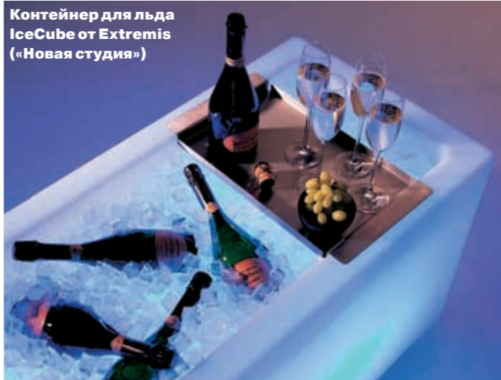
Контейнер для льда IceCube от Extremis («Новая студия»)