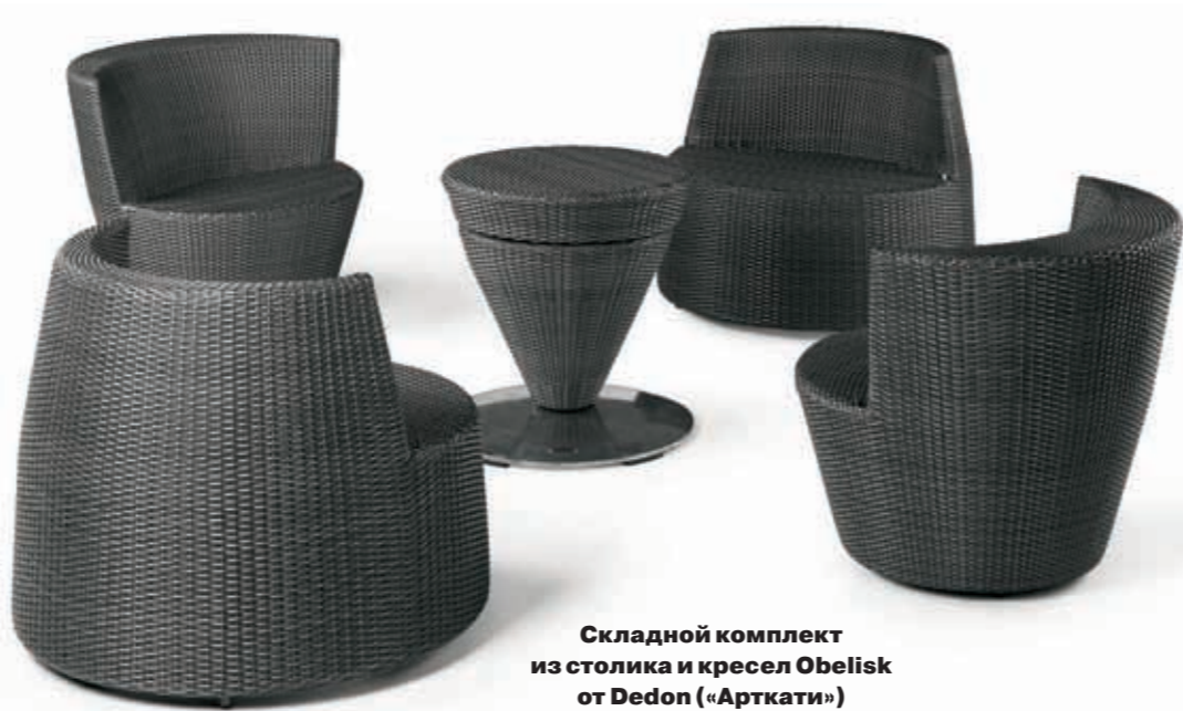
Складной комплект из столика и кресел Obelisk от Dedon («Арткати»)

Armani Casa есть немало складных, точнее, раскладных моделей: столы, которые могут увеличиваться, и шезлонг, который можно превратить в кресло со столиком.