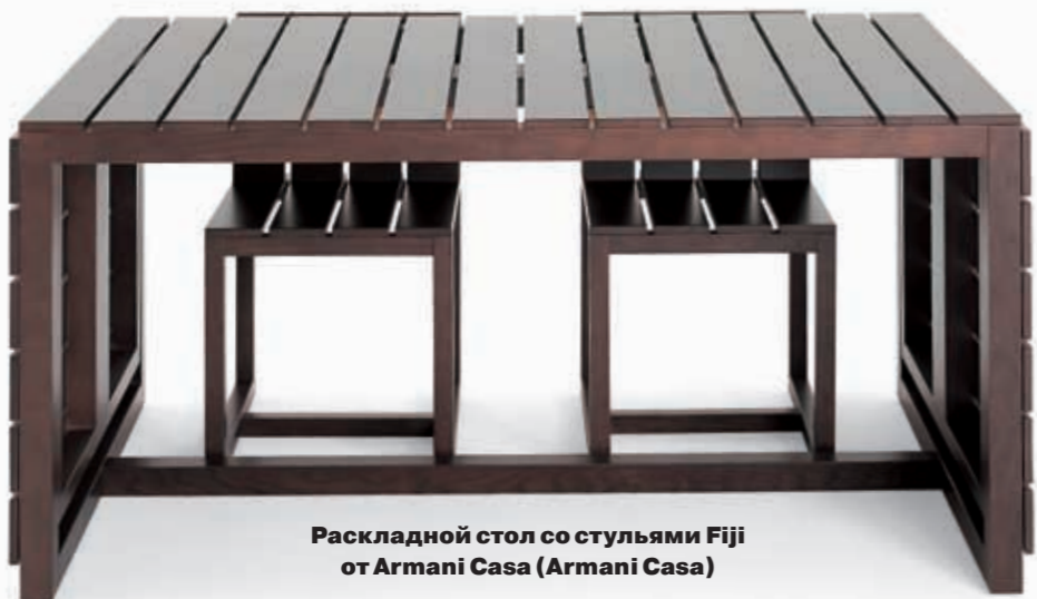
Раскладной стол со стульями Fiji от Armani Casa (Armani Casa)