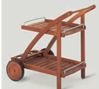
Сервировочный столик от Herlag («Буклотц»)

«Пурпур») специализируется на больших свечах для улицы и водоемов. Если у вас есть бассейн или пруд, сложно придумать более романтическую декорацию, чем плавающие в нем свечи. Если свечи вас беспокоят своей ненадежностью, в коллекции