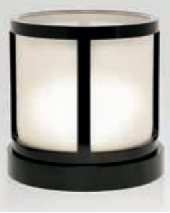
Уличный подсвечник Telemaco от Armani Casa (Armani Casa)

ки. Например, Sprech. Они могут предложить шатры и навесы любого стиля и размера, которые подойдут хоть для частного домашнего праздника, хоть для масштабной корпоративной вечеринки. Неплох вариант беседки. Правда, временным его не назовешь. Но если пойти по пути аристократов прошлых веков, можно привольно раскидать по участку павильоны и беседки. И красиво, и во время праздника пригодится.