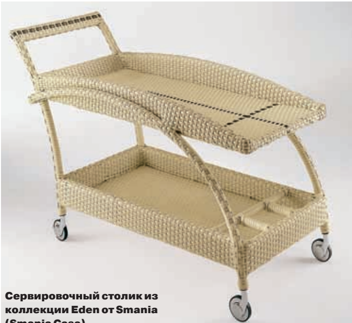
Сервировочный столик из коллекции Eden от Smania (Smania Casa)