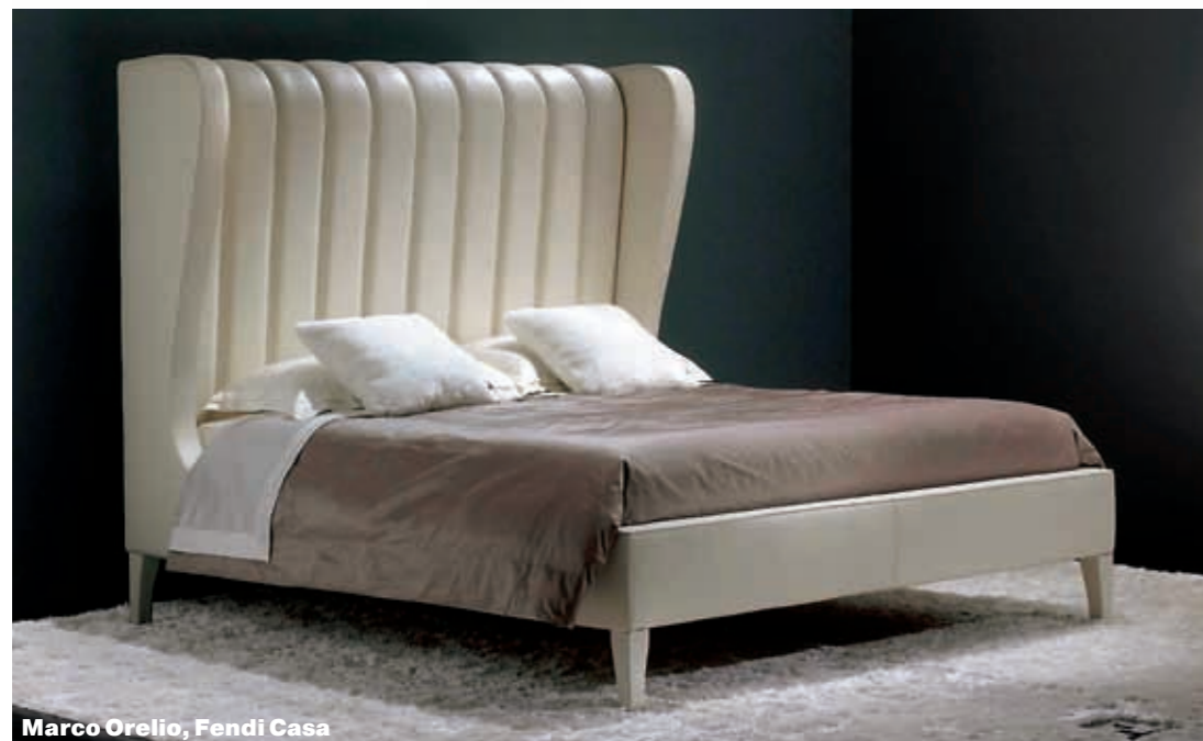
Marco Orelio, Fendi Casa

очень эффектно смотрятся обитая кожей кровать Marco Orelio от Fendi Casa и обитая шелком Tiffany от Colombostile. Экстравагантная марка IPE Cavalli в кровати из новой коллекции Gotech совместила все сразу: высокая спинка с «ушками» (даже скорее с боковыми стенками) ставится отдельно и заменяет ширму. Кровать со спинкой-стенной предложила марка Poliform. Это вообще одна из самых интересных моделей недавнего времени. Задняя часть Dream — это конструкция из мягких панелей, которые можно комбинировать. Расцветка может быть разной, но актуальнее всего смотрится кровать в черно-белой гамме с цветочным рисунком, который придумал (как и саму кровать) один из самых модных дизайнеров — Марсель Вандерс. Если кому-то текстильные панели кажутся непрактичными, то это напрасно. Чехлы из кожи и ткани можно снимать и чистить. В комп-