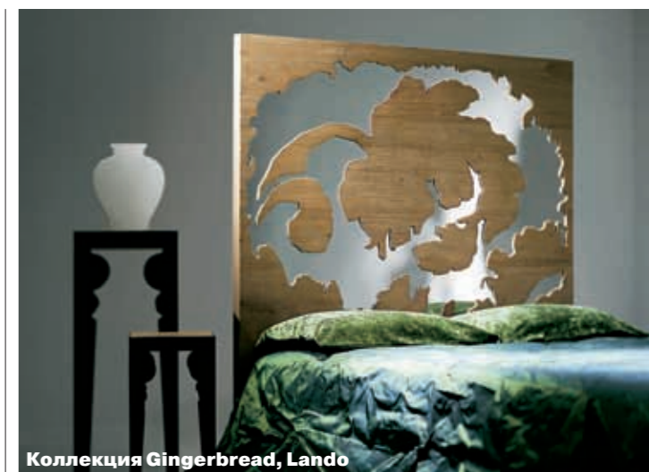
Коллекция Gingerbread, Lando

не предполагают ни массивной защиты, ни богатого окружения. Но при этом они отлично вписываются в генеральную концепцию — кровати как центра жизни и квартиры. Главная их черта — округлость и изогнутость. Собственно, кровать — это место безмятежное по определению, так что тем или иным способом она должна создавать нужное настроение. Плавные линии и округлые формы не самый плохой способ. Абсолютно круглых кроватей при всей простоте этой идеи не так уж много. Уже не первый год выпускает их марка Ivano Redaelli. Ничего экстраординарного в них, кроме формы, нет: они стоят на полу и снабжены невысоким изголовьем (даже экстравагантные люди, которые покупают крупную кровать, нуждаются в том, чтобы на что-то опереться). Более необычно выглядит круглая кровать Fluttua марки Lago — кажется, что она висит в воз-