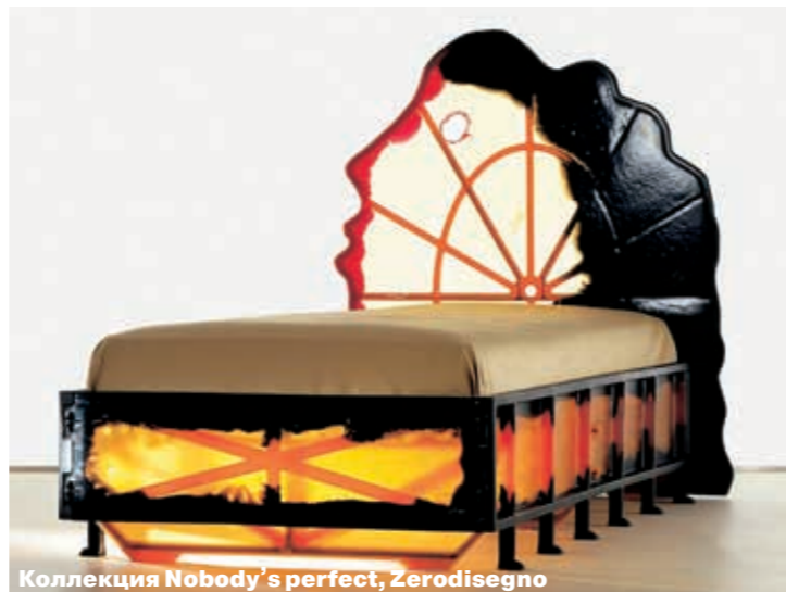
Коллекция Nobody's perfect, Zerodisegno

ет марка Mobileffe. У них не найдешь ни одной модели, которая не была бы чем-то снабжена. Le Notti дизайнера известного минималиста Клаудियो Сильвестрина — это целая конструкция со стеклянной спинкой, подсветкой, шкафчиком, который спрятан за спинкой, и отверстиями для проводов. Идеальный вариант для людей, которые любят работать в кровати. К кровати Eris прилагается также немало аксессуаров: задняя полка, тумбочки с выдвижными ящиками и открытые полки. Модель Flat более лаконична, но предлагает не меньше возможностей. В самом деле, зачем городить вокруг кровати кучу столиков-тумбочек-скамеек, когда можно все совместить. В данном случае предлагаются два столика (или дивана — так как они мягкие, подходит оба варианта), на которых можно сидеть, класть одежду, книги, ставить посуду и т. д. В модели Ross прикроват-