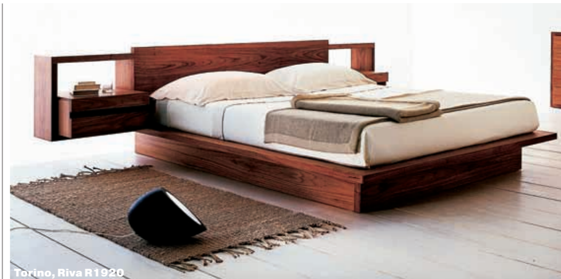
Torino, Riva R1920

Третья главная тенденция как бы противоречит двум предыдущим. Модели из этой серии