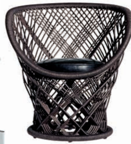
Кресло Pavo, Driade