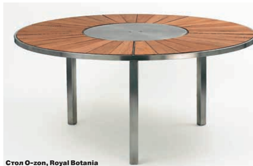
Стол O-zon, Royal Botania

вом ее выносливости (кстати, это касается и Kartell). Удобно то, что часто марка выпускает мебель коллекциями. Например, идеально подходит для сада Striped, придуманная братьями Буруллек: в нее входят разного рода сиденья (кресла, табуреты, стулья, барные табуреты и проч.), столики и шезлонг. «Мягкие» части выполнены из эластичного полиамида, каркас — из стали, покрытой защитным составом. Помимо обычной мебели марка выпускает еще и детскую. Не будет преувеличением сказать, что их коллекция — одна из самых интересных в этой области. Многие предметы можно использовать на улице. А дети, как известно, летом проводят там большую часть времени.