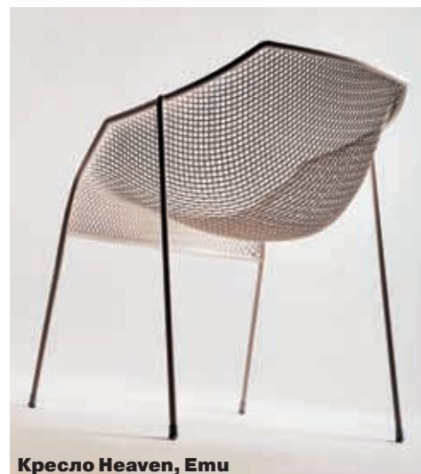
Кресло Heaven, Emu