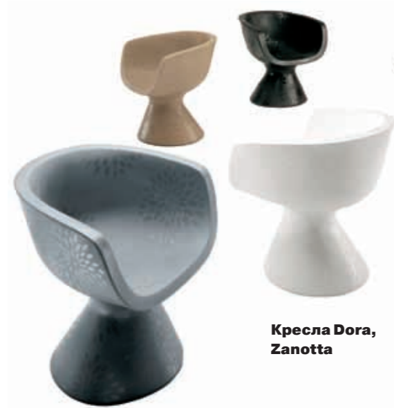
Кресла Dora, Zanotta