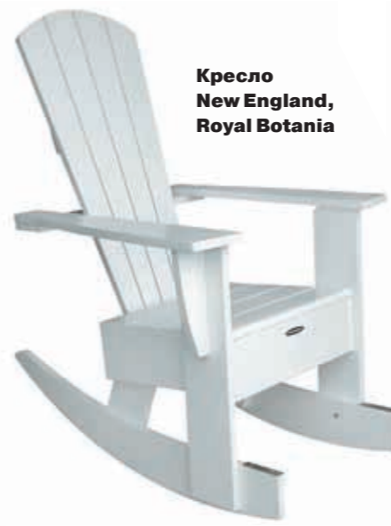
Кресло New England, Royal Botania