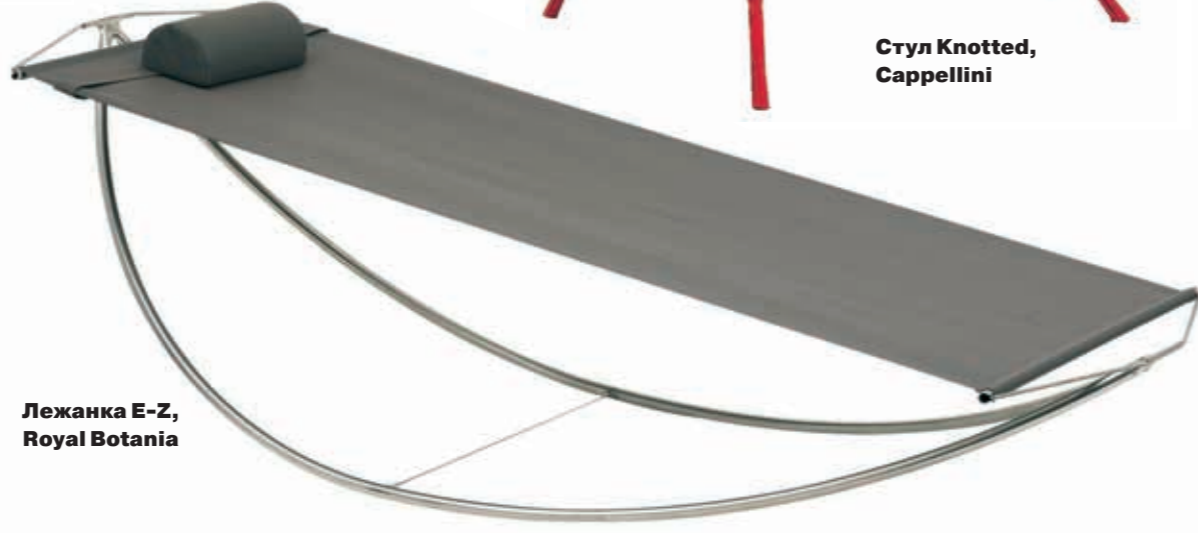
Лежанка E-Z, Royal Botania