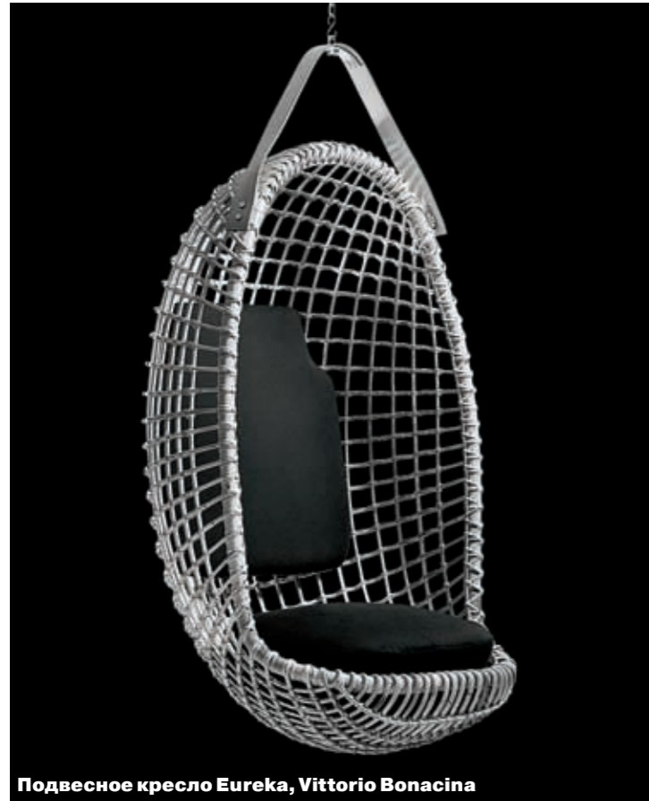
Подвесное кресло Eureka, Vittorio Bonacina

В конце марта довольно сложно представить себя сидящим на веранде в плетеном кресле со стаканом мохито в руке, однако сомневаться не приходится — такой момент определенно наступит. И лучше к нему подготовиться заранее. Для этого есть все условия: в московские салоны уже поступили новые коллекции садовой мебели. Тенденции изучала корреспондент «Ъ-Дома» Юлия Пешкова .