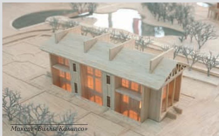
Макет «Виллы Калипсо»