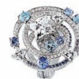
огранки Louis Vuitton — главные камни в новой коллекции L'Amé du Voyage