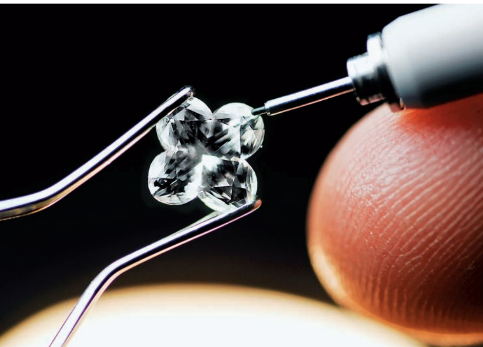
— Flower Cut, 61 фасет