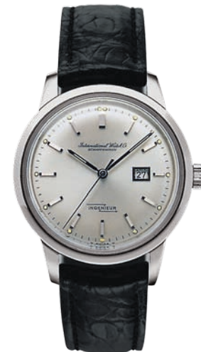
__IWC Ingenieur, 1955