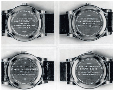
__Vacheron Constantin, «Женевская серия», 1955