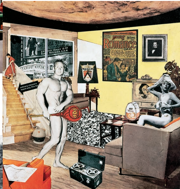
__Коллаж Ричарда Гамильтона «Что же такого в наших современных домах столь разнообразного, столь манящего?», 1956