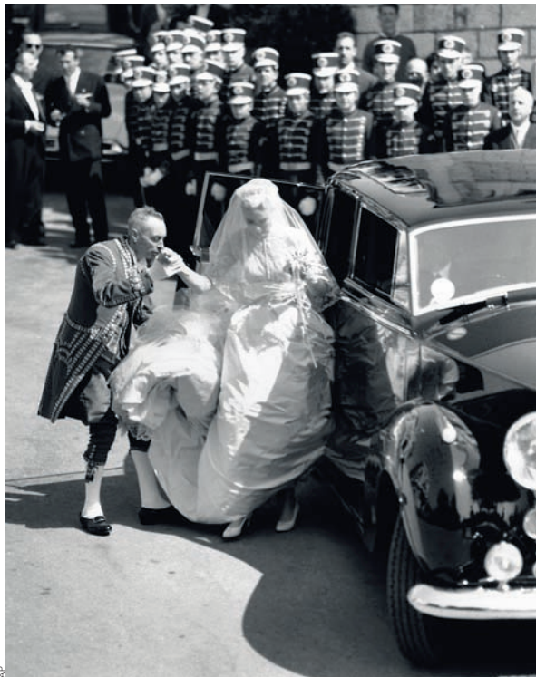
—Грейс Келли приезжает на свадебную церемонию, Монако, 1956