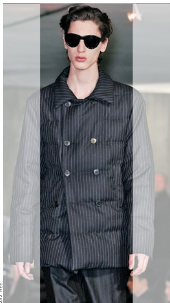
Dries van Noten