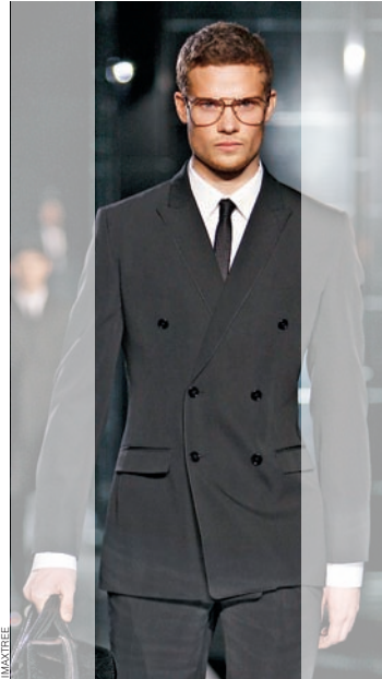
Dolce & Gabbana