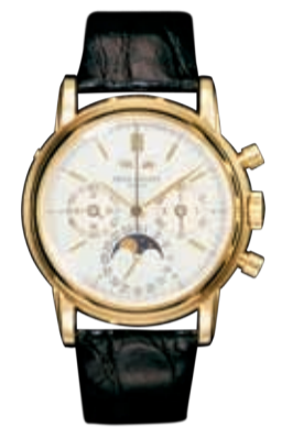
— Patek Philippe, Perpetual Calendar, Moon-phases, 1986