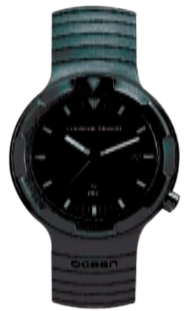
— Porsche Design by IWC, Ocean, начало 1980-х