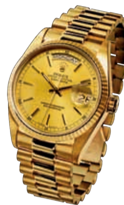
— Rolex, Oyster Perpetual Day-Date, 1983

На Женевском салоне всегда отдают дань какому-нибудь десятилетию XX века, вспоминая часы, лица и события этого времени. На сей раз в центре внимания оказались 1980-е, похожие на завершившиеся 2000-е, годы разгула роскоши. Кризисы 1987 и 2008 годов завершили эру богатства. Ни одну декаду XX века мир не встречал в такой тревоге и не провозжал в такой эйфории, как 1980-е. Под депрессивную музыку «Стены» Pink Floyd человечество обреченно ожидало описанной Джорджем Оруэллом беспросветной тьмы 1984 года. Оруэлл оказался плохим пророком, в отличие от диссидента Андрея Амальрика, еще в 1969-м задумавшегося, «просуществоет ли СССР до 1984 года». В июле 1990-х та же музыка на Potsdamer Platz, в двух шагах от Берлинской стены, сметенной демонстрантами 9 ноября 1989-го, звучала как новая «ода к радости», прощание с холодной войной, с XX веком, с самой историей, о конце которой поспешно объявил (летом 1989 года) футуролог Фрэнсис Фукуяма. А еще недавно ленинградская богема спорила на ящик шампанского, что мировая война разразится в 1984-м. Названия афганского тоннеля Саланг