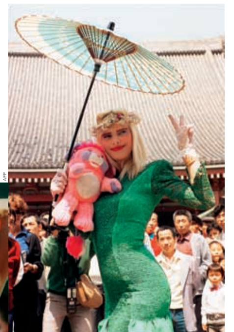
— Американская певица Мадонна и итальянская порнозвезда Чиччолина — два образа сексуальности