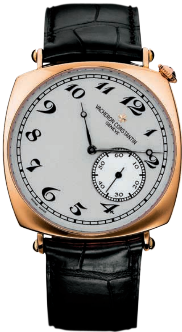
— Vacheron Constantin «Hommage d'Amerique» — современная реплика модели 1921 года