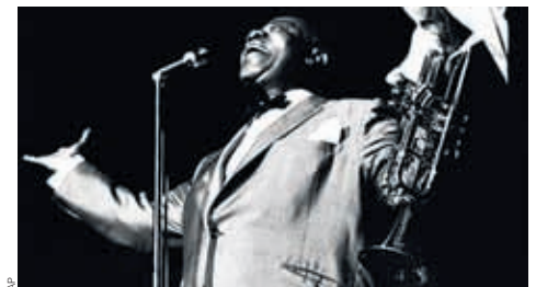
— Луи Армстронг — мечта о голосе Америки

Мечта уникальна еще и тем, что сформулирована в скучнейших жанрах литературного творчества — Декларации независимости (1776), Конституции (1787), Билле о правах (1791): «Все люди созданы равными и наделены Творцом неотъемлемыми правами, к числу которых относятся право на жизнь, на свободу и на стремление к счастью». Вот и все. Пусть даже на каком-то этапе истории «великим уравнителем», если вспомнить циничный эвфемизм времен Дикого Запада, стал револьвер «кольт».