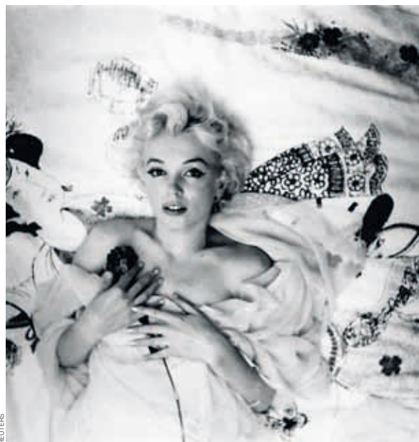
— Мэрилин Монро — мечта об американской девушке