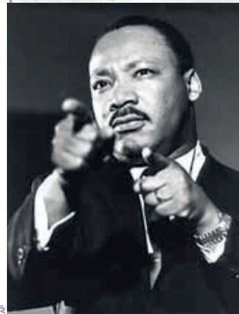
— Мартин Лютер Кинг — мечта о равенстве рас