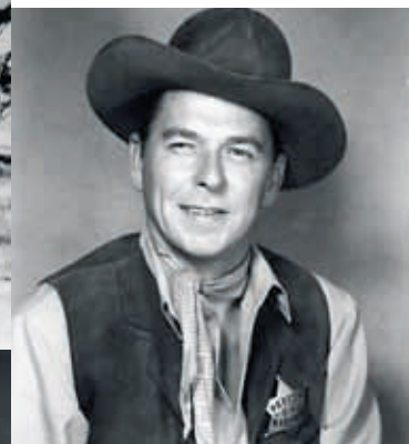
— Рональд Рейган — мечта о защитнике западного мира