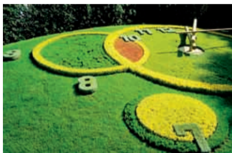
28___ Зимнее время на Женевских часах. Тенденции SIHH-2009

Это было особенно заметно в день открытия, когда приглашенные разрывались между тем, чтобы услышать речь президента салона и транслировавшееся CNN выступление нового президента Соединенных Штатов Америки. Не только для того, чтобы узнать, какие часы на руке у Барака Обамы, но и для того, чтобы понять, куда крутанутся стрелки в новом мире, в новом году.