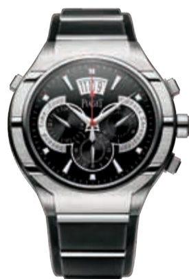
39___ Знаменитые Polo Piaget отмечают 30 лет