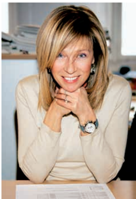
42___ Главный редактор русского Vogue Алена Долецкая о своих любимых часах