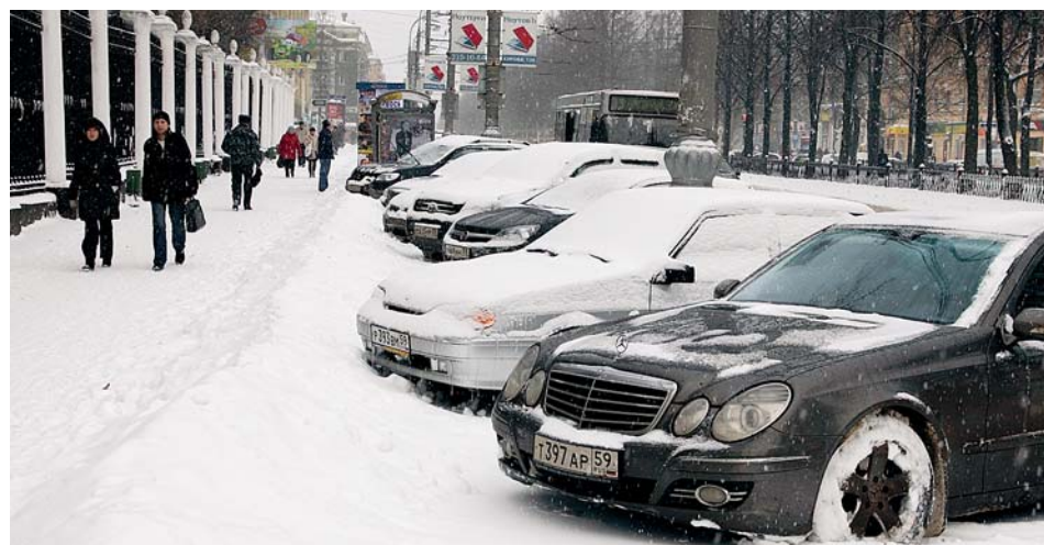
2009 год стал настоящим «ледниковым периодом» для пермских автодилеров. После бойкой торговли до кризиса их продажи упали сильнее всего по России — на колоссальные 75%

В компании «УралАвтоИмпорт» отмечают, что в регионе снизились объемы продаж всех представленных марок. Самый