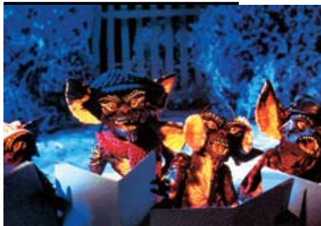
«Гремлины», режиссер Джо Данте, 1984