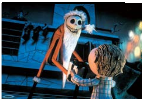
«Кошмар перед Рождеством», режиссер Генри Селик, 1993