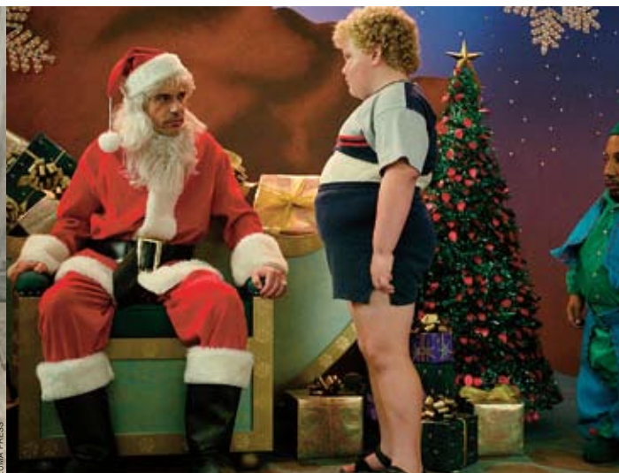
«Плохой Санта», режиссер Терри Цвигофф, 2004