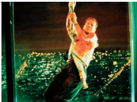
«Крепкий орешек», режиссер Джон Мактирнен, 1988

На самом деле есть важнейшее исключение — эта история про то, как во время рождественского корпоратива небоскреб, который занимает корпорация Nakatomi, захватывает банда бескомпромиссных террористов во главе с чем-то даже симпатичным Гансом Груббером. Помочь заложникам может лишь один человек — заехавший в очередной раз поныть перед разводящейся с ним женой полицейский Джон Макклейн. Даже удивительно, что фильму с таким заурядным сюжетом удалось стать самой что ни на есть новогодней сказкой, причем такой, каких мало.