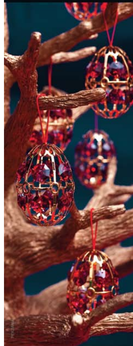
Набор ёлочных игрушек