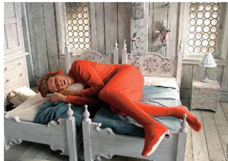
«Эльф», режиссер Джон Фавро, 2003

Режиссер Терри Цвигофф, ничем таким особенно не примечательный, снял роскошную и очень умную пародию на всю новогоднюю мишуру (возможно, благодарности за это заслуживает не столько он, сколько спродюсировавшие фильм наши любимые братья Коэн). Начать с главных героев — Билли Боб Торнтон в роли алкоголика, тунеядца и ворюги, эталонного американского Афона, подрабатывающего в торговом центре Санта-Клаусом, и его напарник по кражам, не менее аморальный карлик-негр. В конце фильма плохой парень, как собственно и Афоня, уверенно становится на путь исправления, но мы понимаем, что самое главное происходит до этого вызывающего уважение хода.