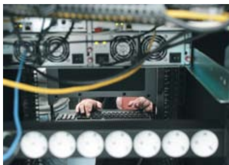
ЗА СЛОЖНЫМИ IT-РЕШЕНИЯМИ ВСЕГДА СТОЯТ «РУЧНАЯ НАСТРОЙКА» И ОПЫТ СПЕЦИАЛИСТОВ