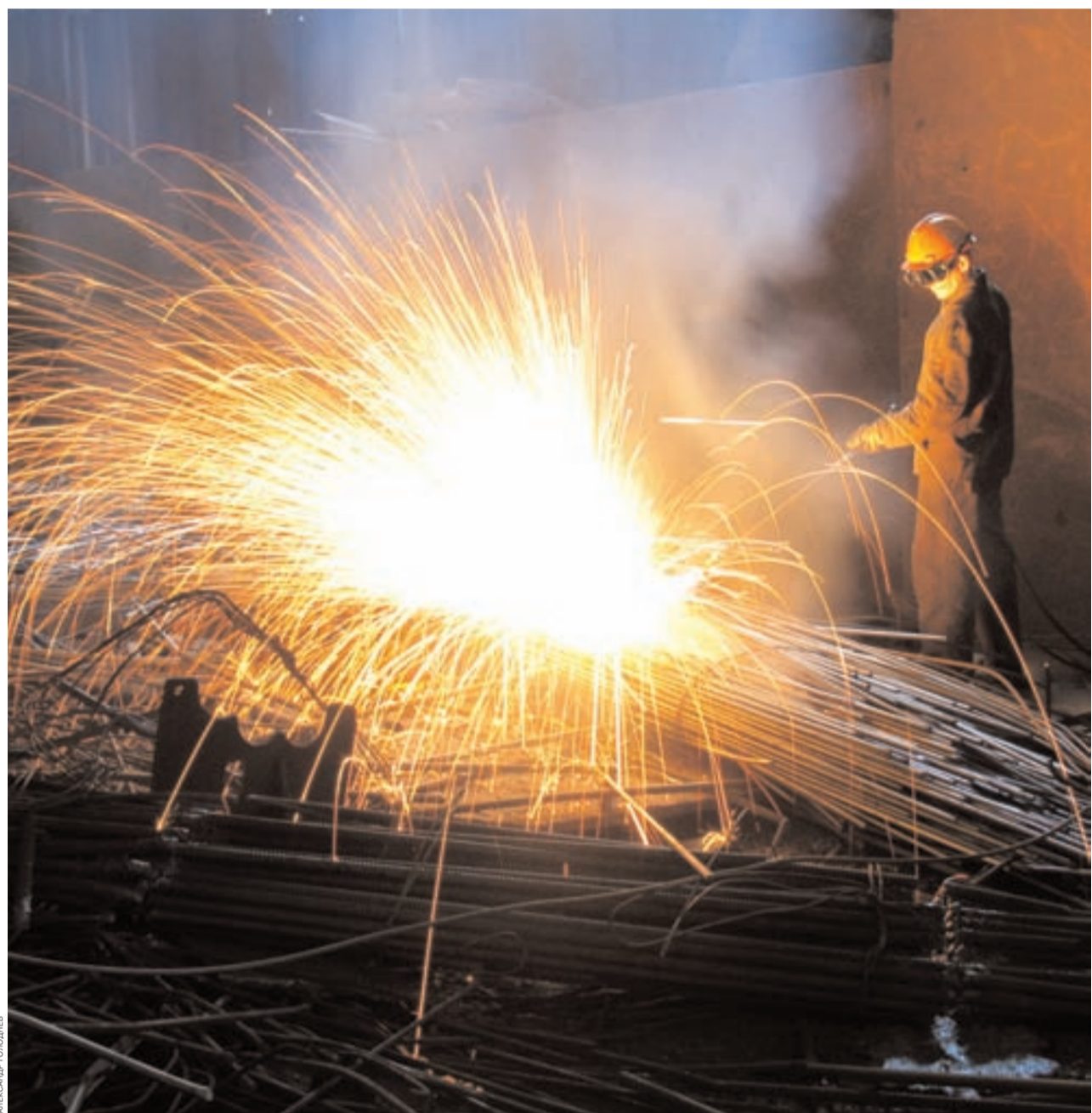
На «Амурметалле» готовятся к возобновлению производства и запуску металлургических печей после вынужденной остановки

В планах компании был и выпуск судовой стали — в начале марта 2009 года «Амурметалл» получил сертификат GL, которым удостоверяется, что компания прошла испытание в соответствии с правилами германского регистра Lloyd — ведущее международное общество по классификации судов одобрило производство непрерывных листовых заготовок, изготовленных из обычной и высокопрочной корпусной конструкционной стали. Этот сертификат производитель получил всего на один год, но после проведения испытаний на механические свойства судостали его можно продлить еще на три года. Также дальневосточный производитель вел подготовку к сертификации продукции в Британском Lloyd's Register Quality Assurance. В целом стоимость инвести-