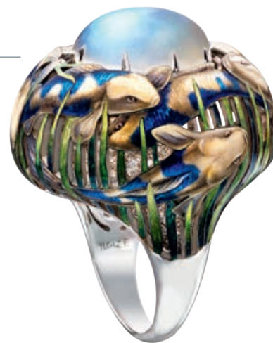
— Кольцо «Карпы»

бы прийти к тому, что сейчас делаю. Появились бы рамки. Тогда я воплощал в жизнь любую свою идею, не задумываясь, возможно ли это. Первую коллекцию украшений с эмалью я сделал в 1996 году. Оставалось всего несколько месяцев до выставки во Франции, в Пуатье, в которой меня пригласили участвовать, она должна была открыться в марте, а в конце января один знакомый привез из Москвы эмали и в двух словах объяснил, как с ними работают. Я подумал, что у меня есть опыт работы с витражами, почему бы не попробовать эмаль? Тем более мне всегда не хватало цвета в украшениях, тогда я еще делал традиционные национальные вещи, отсылавшие к культуре волжских булгар. И вот я попробовал поработать с эмалью, и мне невероятно понравилось: за январь—март я создал совершенно новую коллекцию и привез во Францию только ее. До сих пор эмаль занимает одно из главных мест в моих украшениях. Причем сейчас, когда я смотрю на свои старые работы, я иногда не понимаю, как мне вообще удалось это сделать. Был у меня, например, браслет, целиком покрытый эмалью. Сейчас мой опыт говорит, что невозможно такой сделать, но сделал же!